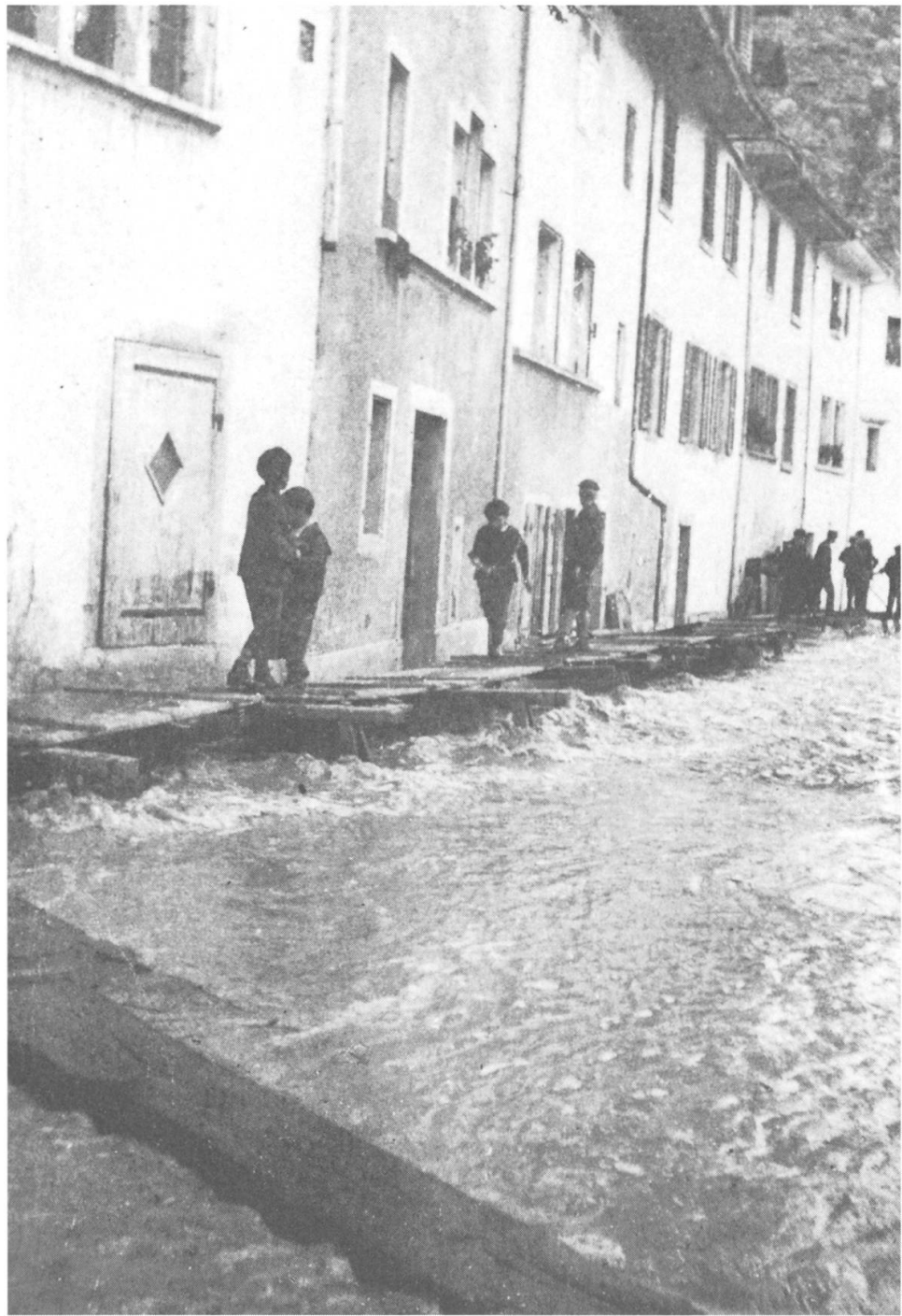
Die untere Reussgasse 1910 mit dem erstellten Notsteg.

Weiter berichtet er detailliert: «Es war denn die Reuss in schneller Zunahme begriffen und hatte Dienstag abend bereits den gewöhnlichen Hochwasserstand erreicht. Die über Nacht offenen Wolkenschleusen liessen sie noch weiter wachsen und hoben sie vollends über ihre Grenzen. Morgens 7 Uhr war sie schon in die Reussgasse von Bremgarten eingedrungen, die Anwohner begannen sich durch Verstopfen der Haus- und Kellertüren des nassen Elementes zu erwehren, das indes unaufhaltsam stieg. Abends 4 Uhr war die Reussgasse eine reissende Wasserstrasse