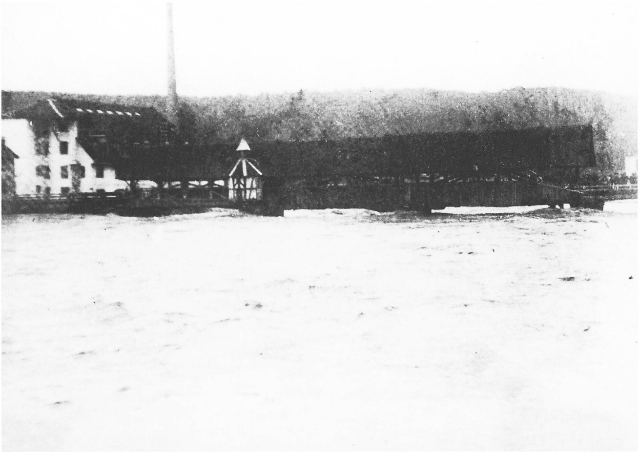
Die Reussbrücke 1910 , von Wasser- massen bedrängt. Links im Bild die Bruggmühle mit Hochkamin.

Ohne Wasser und Licht blieb die Stadt während zwei Nächten, da die Bruggmühle den Betrieb eingestellt hat, die Turbinen sind eingesandet. Demzufolge blieb der letzte Tramzug am Mittwoch aus. Der Fahrkurs konnte sonst aufrecht erhalten werden.