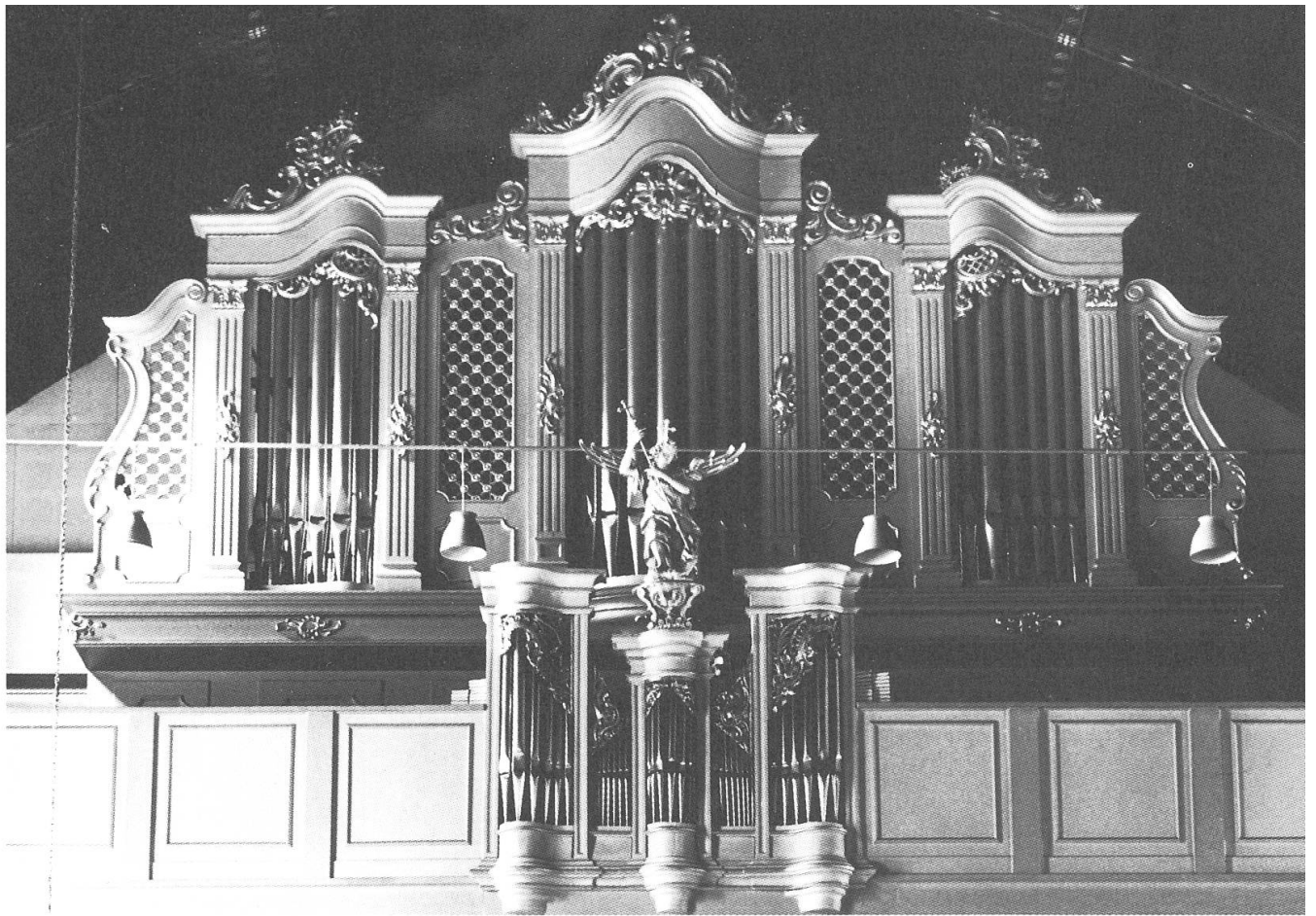
Kuhn-Orgel, 1953