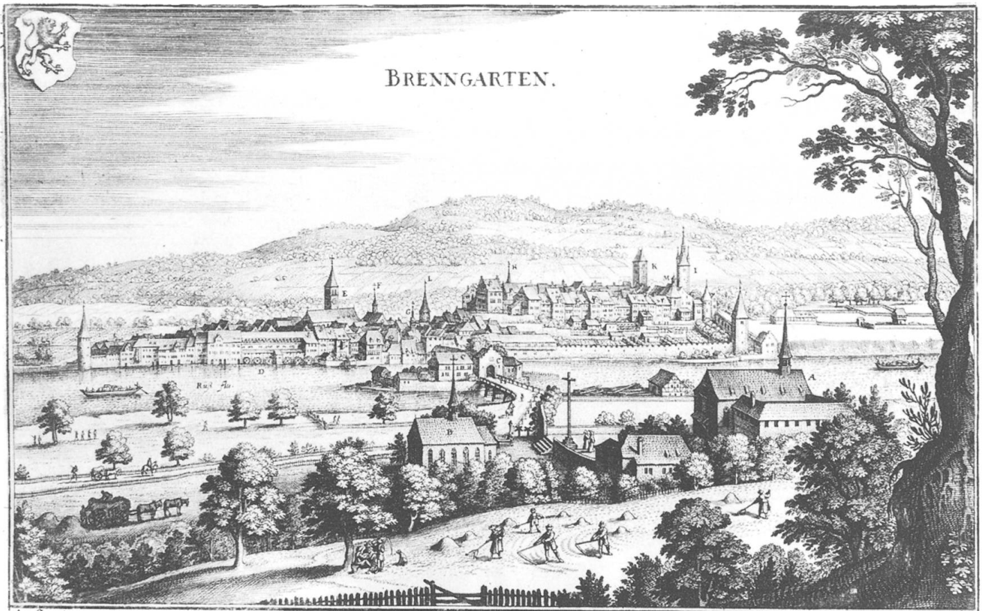
A. Capuciner Closter. B. Heilig Creutz. C. Rußbrück und mühle. D. Pappmühl. E. Pfarrkirch. F. Schwesterhaus. G. Beinhaus. H. Closters Mürihof. I. Oberthor. K. der Platzthurm. L. Hermanns thurn. M. der Spital.

Mathäus Merian 1654, Stadtansicht von Bremgarten 1654 aus seiner Topographia Helveticae .