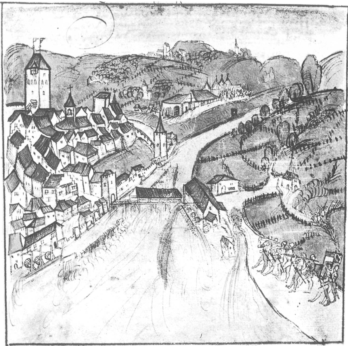
Werner Schodoler, Illustration zum Alten Zürichkrieg 1443 , kolorierte Federzeichnung aus seiner Bilder- chronik um 1514.

die Möglichkeit zur grosszügigen Durchfensterung erhielt sie erst nach Abbruch des Spittels und Öffnung der Marktasse.