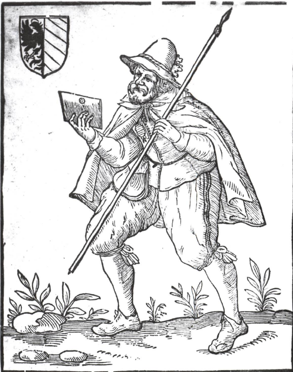
Abbildung: Der Nürnberger Briefbote (Holzschnitt, Germanisches Nationalmuseum, Nürnberg).

Heutzutage werden nur noch wenige Briefe geschrieben; wir greifen eher zum Telefon oder versenden ein E-Mail. Ganz anders in der Reformationszeit: Damals war der Briefverkehr von entscheidender Bedeutung. Es gab ja noch kein Telefon, aber auch noch keine gedruckte Zeitung. Alles, was man einander nicht mündlich erzählen konnte, musste per Brief mitgeteilt werden. Dabei vergessen wir leicht, dass Lesen und Schreiben nur einem kleinen Teil der Bevölkerung geläufig war. Die Kirchenleute und andere Gelehrte beherrschten diese Kunst, wie sie an den Latein-