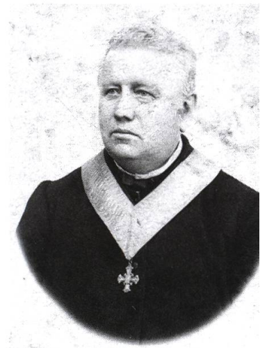
Jakob Stammler , Bürger von Bremgarten, ist zum Bischof gewählt worden.

10. Juli Der Bauverwalter zeigt an, dass Photograph Lüthy den sogen. Kapuzinerbrunnen des öfteren entleere, um seine Spülapparate functioniren zu lassen. Mit Rücksicht auf ein zur Zeit gestelltes Ansuchen Lüthys, wird die Benutzung des Brunnens auf Zusehen hin einstweilen noch gestattet, doch soll dies nur zur späten Nachtzeit, d.h. zu einer Zeit stattfinden, da der Brunnen sonst von niemandem benutzt wird. Lüthy soll eine bezügliche schriftliche Erklärung ausstellen und es soll die Bewilligung dahinfallen, wenn irgendwie zu Reklamationen Anlass gegeben wird.