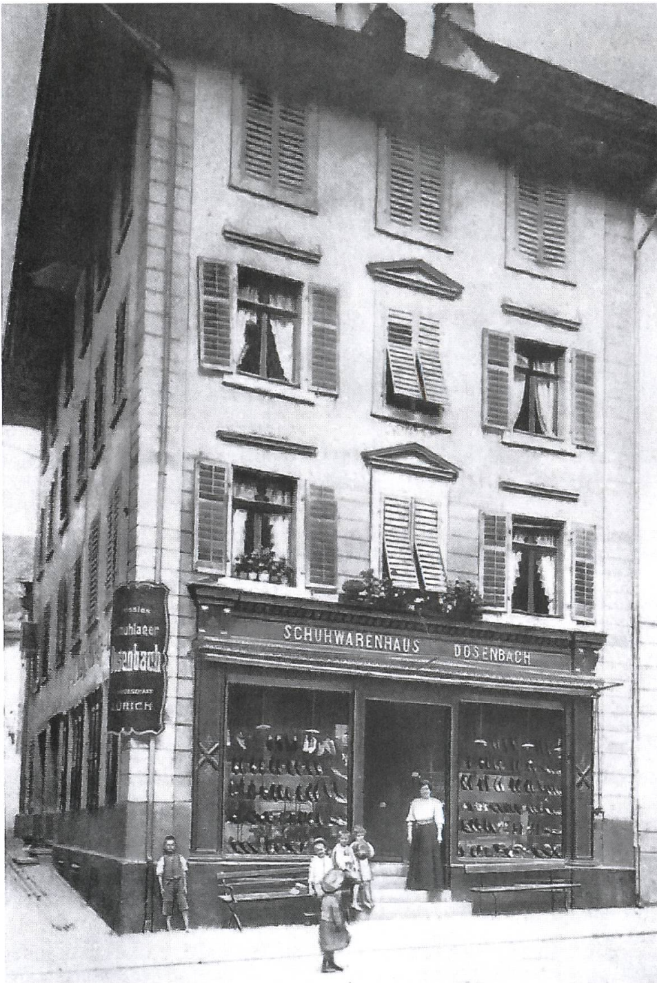
Das Dosenbach-Schuhgeschäft um die Jahrhundertwende an der Marktstrasse 23 in Bremgarten.