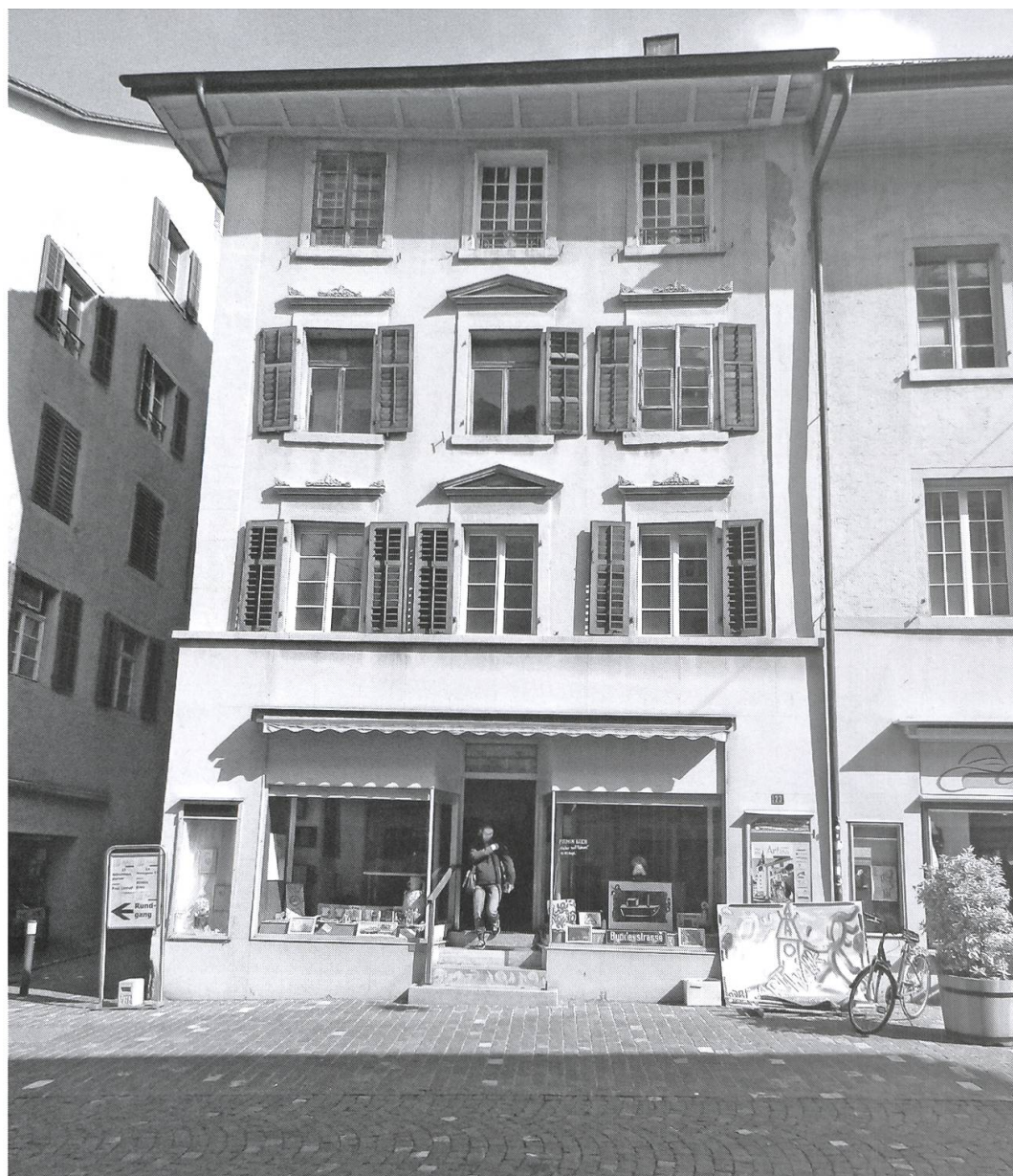
An der Marktgasse 23/ Ecke Bäregasse befand sich das Dosenbach- Schuhhaus von 1865 bis Ende 1940 (Foto: Jörg Baumann).

gisser versuchte, in Verhandlungen mit dem Stadtrat den Wegfall der Gedenkstätte zu verhindern – leider erfolglos. Nicht zuletzt, weil auch ein Verwandter, der in die Familie Dosenbach eingeheiratet hatte, sich dagegen ausgesprochen hatte. Selbst eine Erinnerungstafel fehlt am ehemaligen Schuhhaus an der Marktgasse.