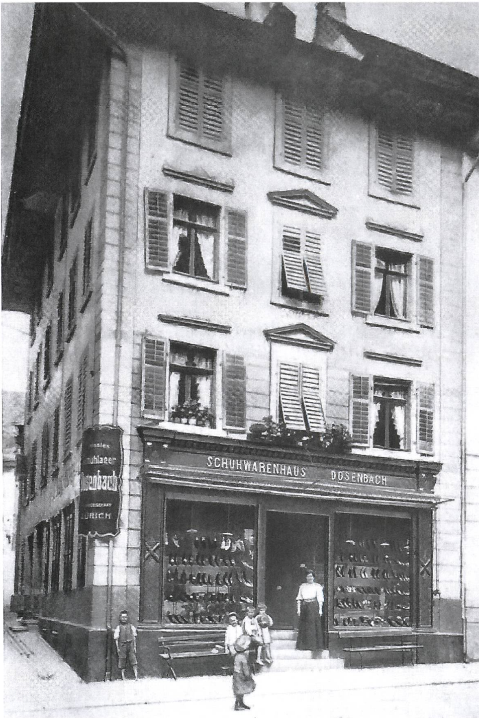
Das Dösenbach-Schuhgeschäft um die Jahrhundertwende an der Marktasse 23 in Bremgarten.