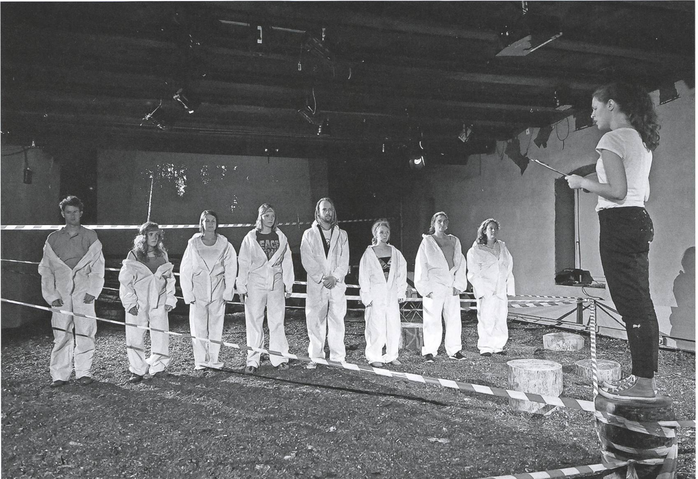
«Wald:Park», das zweite Projekt der «Jungen Bühne», der neuen Eigeninszenierungssparte des Kellertheaters August 2016. Inszenierung Simon Landwehr.

Erdgeschoss verloren. Dafür wurde die Wohnung im dritten Stockwerk aufgelöst und dem Theater als Büro und für sonstige rückwärtige Räume zur Verfügung gestellt. Dies löste einige der zuvor bestehenden Platzprobleme.