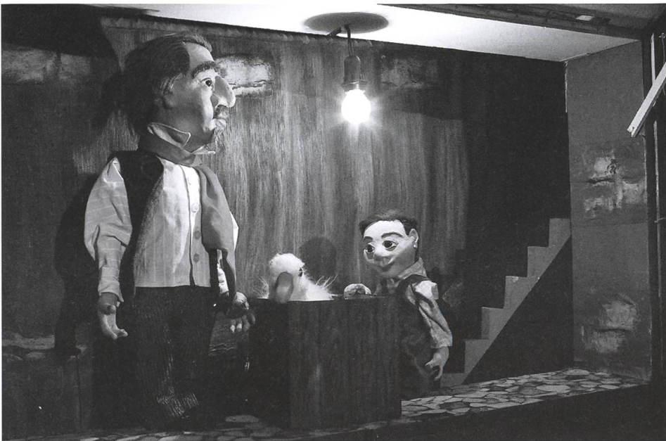
Die Weihnachtsgans Auguste. Figurentheater 2014.

die frühere Tradition der Märcheninszenierungen für Kinder wieder auf, nun eben in der Form des Figurentheaters. Die Gruppe erarbeitet ihre Stücke selbst und baut auch das Bühnenbild und die Figuren selber.