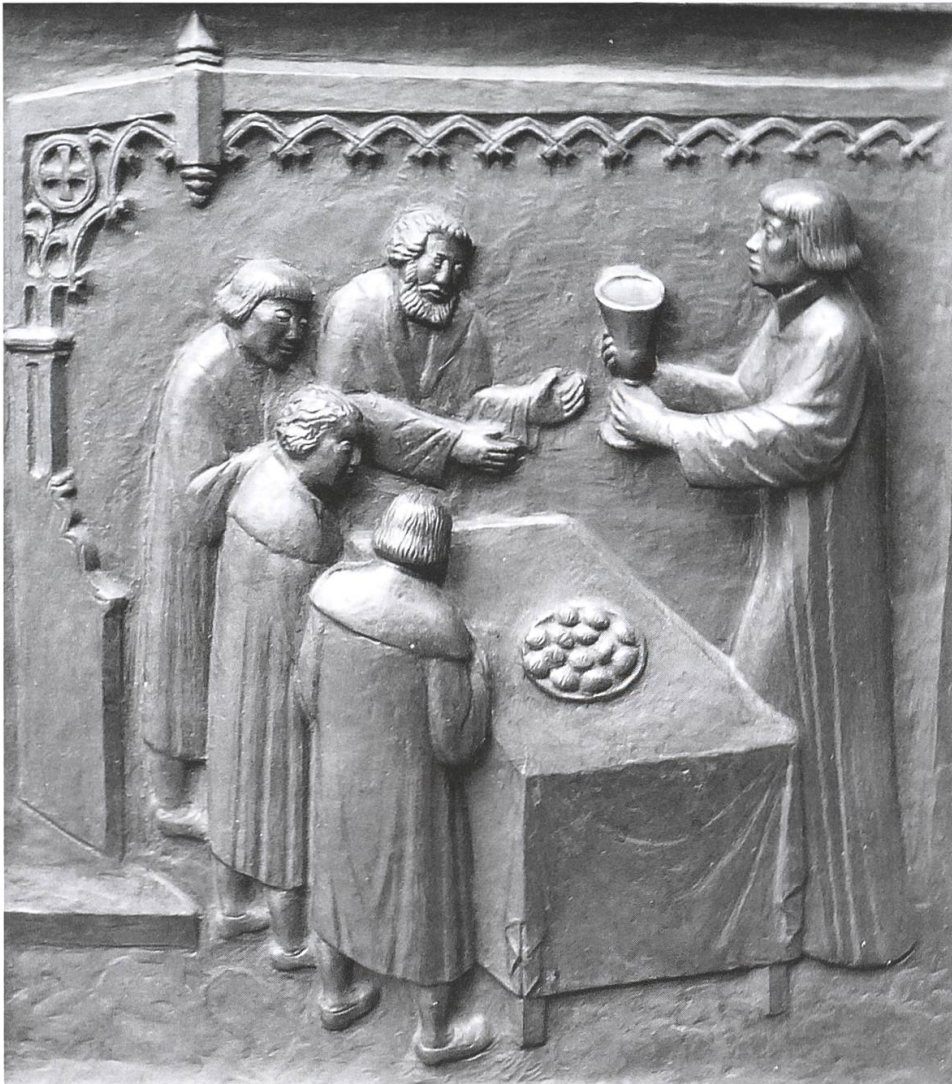
Die Feier des Abendmahls. Die Gemeinde ist um den «Tisch des Herrn» versammelt. Zwingli als evangelischer Pfarrer hebt den Kelch und reicht ihn den Kirchgängern. Im Teller liegen Brote, die anschliessend verteilt werden. Christus ist im (Heiligen) Geist anwesend. Bronzeportal am Zürcher Grossmünster.