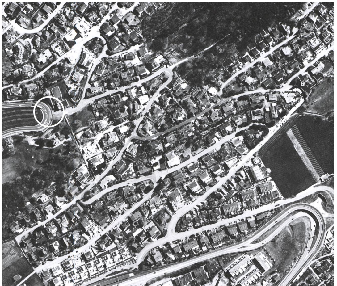
Zufikon 2017.

chen Jahr Konkurs anmelden musste, merkte man, dass die Sicherheiten nicht genügten. Die Rechnungsprüfungskommission kommentierte das Geschehene an der ordentlichen Gemeindeversammlung vom 27. Juni 1975 so: «Nach unserem Dafürhalten wurde die Anlage vom Gemeinderat vorschriftswidrig getätigt. Zur Zeit steht nicht fest, wie gross der Verlust aus diesem Geschäft ist und wer für einen allfälligen Schaden aufzukommen hat.» (11) Zwei Monate später musste der Gemeinderat an der turbulenten ausserordentlichen Gemeindeversammlung vom 22. August 1975 einige Vorwürfe einstecken, sich Wörter wie «Machenschaften» gefallen lassen – ebenso wie die Forderung, die Gemeinderäte hätten persönlich für den Schaden zu haften.