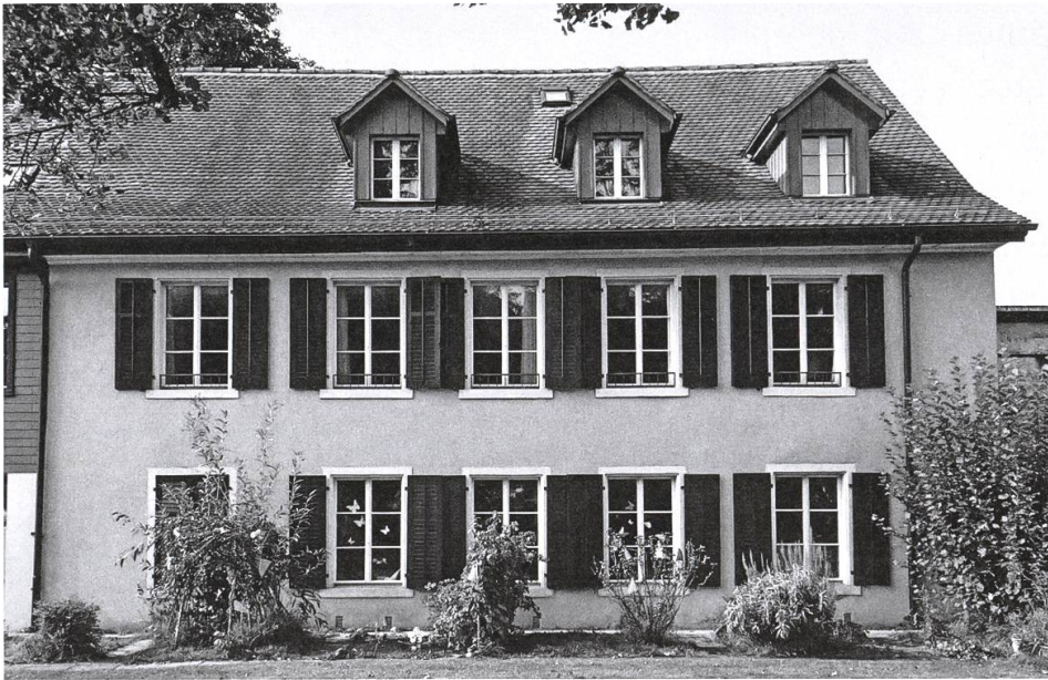
Kleinkinderschule, heute Kindergarten, in der Unterstadt. Ende Juli 1918 liess der Gemein- derat Bremgarten dort ein Krankenlokal für Grippekranke einrichten.

1918 handelte auch die kantonale Sanitätsdirektion und verfügte ein allgemeines Versammlungsverbot. Alle Veranstaltungen, welche zahlreiche Personen am gleichen Ort oder im gleichen Raum zusammenbrachten, wurden bis auf weiteres verboten. Dies betraf unter anderem Theateraufführungen, Konzerte oder Volksfeste. Der Schulbetrieb musste eingestellt werden, «ebenso der gemeinschaftliche Gottesdienst in Kirchen und Kapellen». Besuche bei Grippekranken waren nicht mehr gestattet. Einige Tage später ordnete der Gemeinderat von Bremgarten an, die Kleinkinderschule (Kindergarten am heutigen Klosterweg) «in ein Krankenzimmer für den Eventualfall umzuwandeln» und dazu fünf bis sechs Betten aus dem Armenhause dorthin bringen zu lassen. Die Kleinkinderschule musste ins alte Knabenschulhaus (ehemaliges Klarakloster) dislozieren. Ausserdem hatte der Strassensprengwagen alle Strassen der Unterstadt zu befahren, wobei dem Wasser ein bestimmtes Quantum Lysol beigemischt werden sollte. (9)