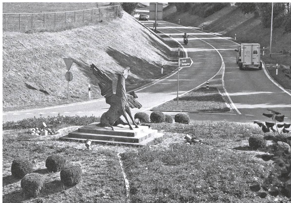
Pegasus-Kreisel. Bild: Melanie Keusch, August 2018.

Pegasus ist das Kind von Poseidon und Medusa, dem Ungeheuer mit Schlangenhaaren, dessen Blick jeden zu Stein erstarren lässt. Pegasus entsprang dem Blutstrahl aus Medusas Hals, als sie vom griechischen Helden Perseus geköpft wurde. Der Geflügelte