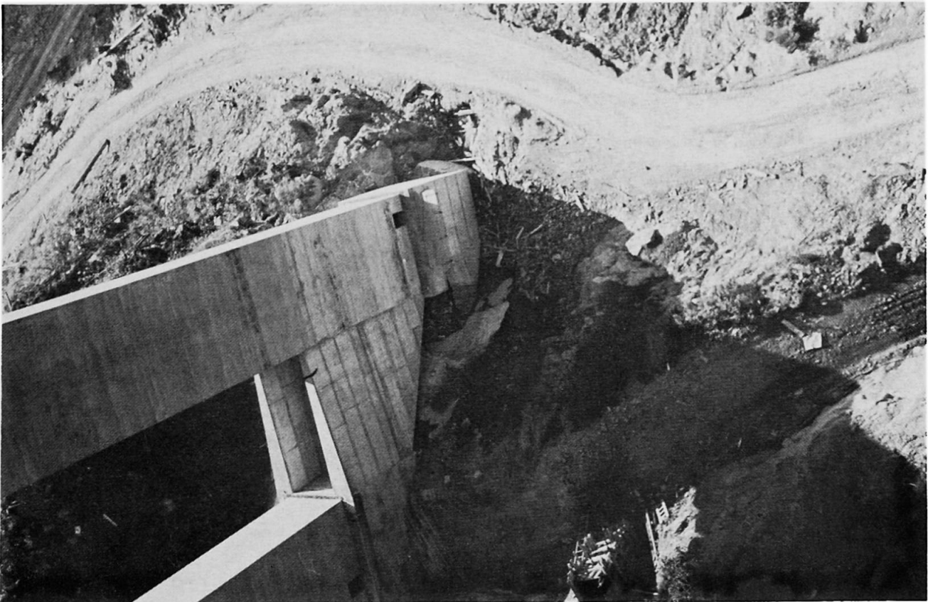
Bild 2 Pfeilerfuß mit Zufahrtsstraßen (von der Brücke aus nach unten gesehen)

Auf diese Weise wurden bis zu 83 Elemente, d.h. 268 m Tragwerk in einem Monat hergestellt.