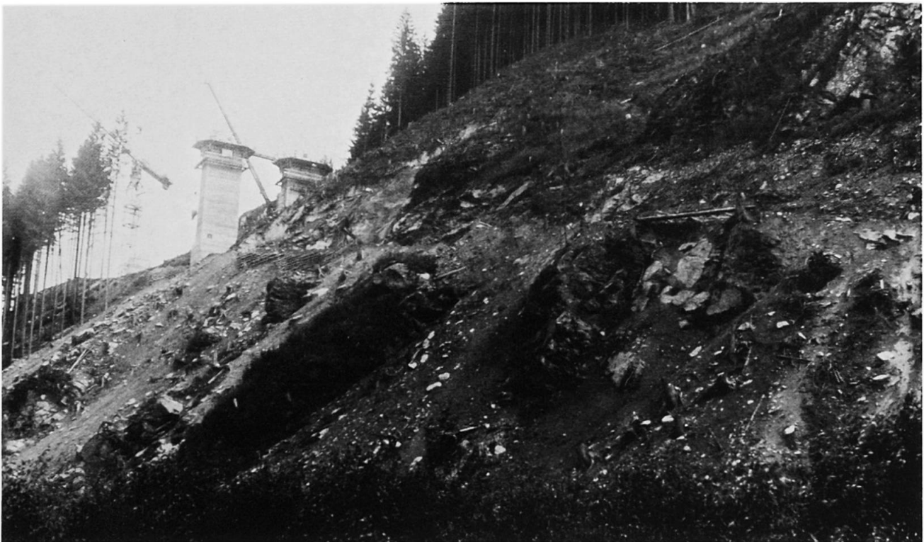
Bild 1 Geländeform

Voraussetzung hierfür ist die sorgfältige Bauführung und die laufende Überprüfbarkeit des Effektes der Sicherungsmaßnahmen über einen Zeitraum von mehreren Jahren.