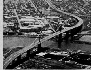
West Gate Bridge , Melbourne, Australia—main span 336 metres.