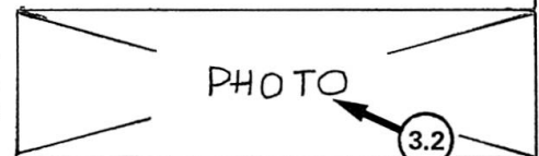
Fig. 2 Column Deformation