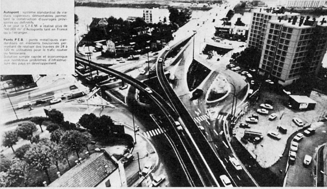
Autopont de Bezons

Autopont système standard de six cours, supports démontables permet tant la construction d'ouvrages primé- naires ou définitifs. Autopont type P.E.B. à trois voies de 100,00 m d'Autoponts lancés en France sur le territoire. Ponts P.E.B. : ponts métalliques stan- dardisés en matière bascoines per- mettant de réaliser des travées de 24 à 120 m adaptées pour le trafic routier et ferroviaire. Solutions simples, rapides et économiques pour franchir rapidement et efficacement tous les pays en développement.