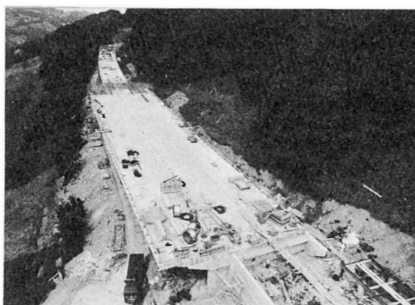
Vue du chantier depuis le mât du blondin; au premier plan, le tablier est entièrement bétonné; plus loin seul le caisson est exécuté.