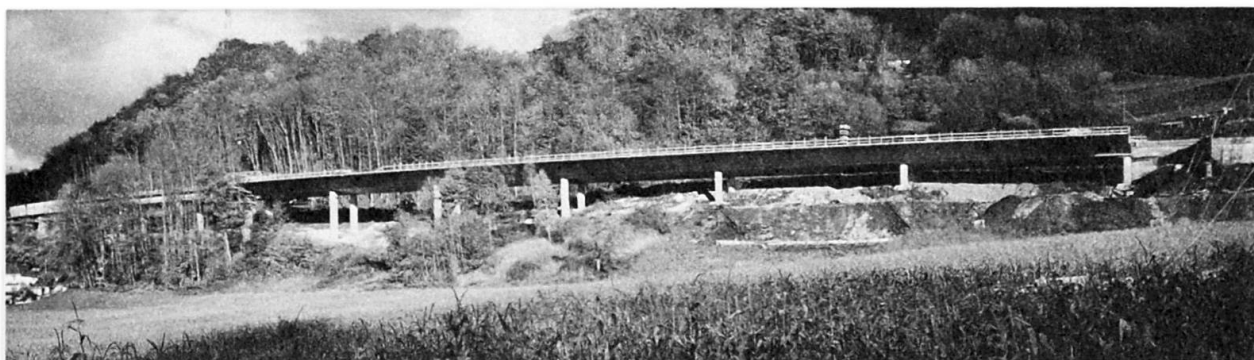
Vue du pont du Cucloz

Les piles du pont principal sont de forme hexagonale pour des raisons de statique et d'esthétique, de dimensions maximales 2,00 x 1,40 m. Toutes les piles, dont l'effort horizontal engendré par la variation de longueur du tablier est inférieur à celui de frottement d'un appui glissant, sont liées au tablier. Elles garantissent la stabilité longitudinale de l'ouvrage, les autres piles étant munies d'appuis glissants. Les palées de l'estacade sont de forme rectangulaire, avec les