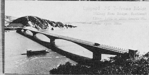
Largest PC T-frame Bridge Wuyang River Bridge. Southeast China. built in 1971. Length 520m. Main span 184m.