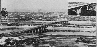
Dan River Bridge. North China. built in 1959. Single span 88m.