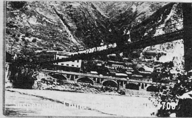
Tadu River Bridge. Southwest China. 13 iron chains. Span 100m. Width 3m.