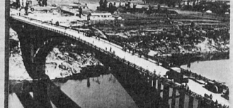
Laju Bridge. Southwest China. built in 1967. Span 112m.

Belt-welded Steel Truss Arch Railway Bridge