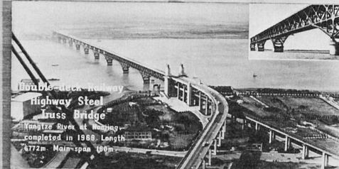
Double-deck Highway Steel Truss Bridge Nanjing River at Nanjing. completed in 1968. Length 1772m. Main span 196m.