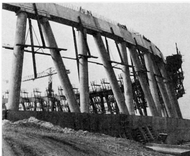
Poutre-linteau périphérique terminée. Montage de l'échafaudage du coffrage autogrimpant

Elle est également renforcée à sa partie inférieure par une poutre-linteau de 85 cm d'épaisseur maximale. L'épaisseur minimale est de 16 cm et comporte des armatures intérieures et extérieures enrobées d'un minimum de 4 cm d'épaisseur de béton. Celui-ci ne contient pas d'accélérateur de prise, bien que nécessitant une résistance précoce assez importante en fonction des efforts qu'il subit après un ou deux jours lors du levage du coffrage grimpant et de son échafaudage. L'aspect et l'étanchéité de la coque (aucun enduit de ciment ni de bitume n'est nécessaire à l'intérieur de la coque) sont directement liés à la qualité et aux caractéristiques des agrégats employés.