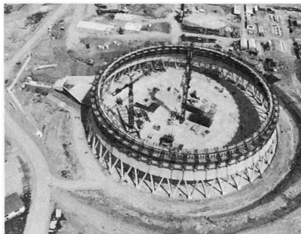
Coque en cours de construction

L'exécution de la coque qui a eu lieu pendant la bonne saison a nécessité 8500 m 3 de béton mis en place à raison de 75 m 3 par jour en moyenne, avec des pointes de l'ordre de 150 m 3 lors de l'exécution des renforts.