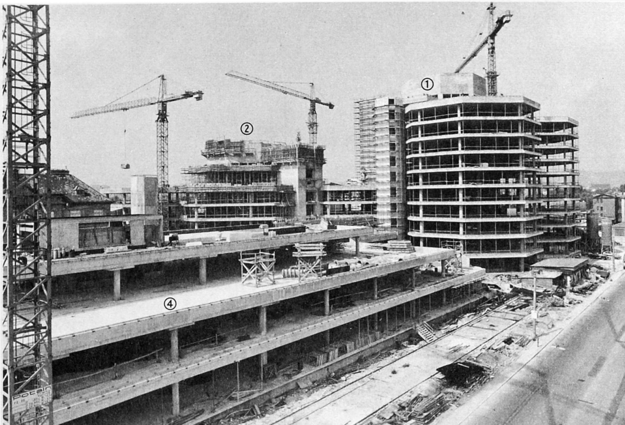
Verwaltungsteil: Bauteil A ① Bauteil B ② Fachärztliche Begutachtungsstation ④