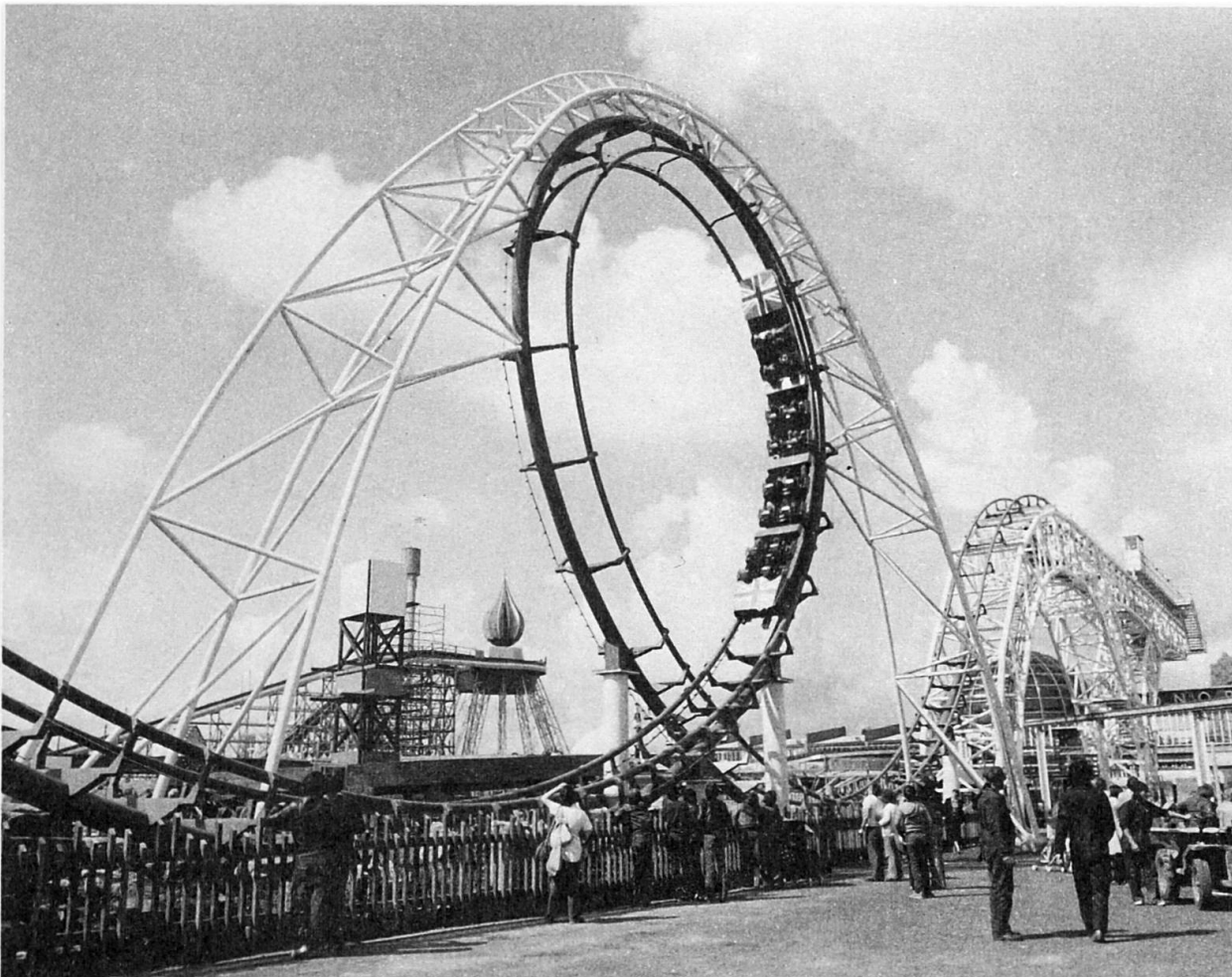
Fig. 2 Central loop and arch