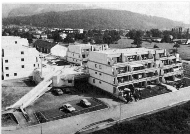
Wohnform Rankweil – Teilansicht

Ebenerdig und teilweise unter der Fussgängerebene sind die Parkflächen für PKW – keine Tiefgarage – angeordnet.