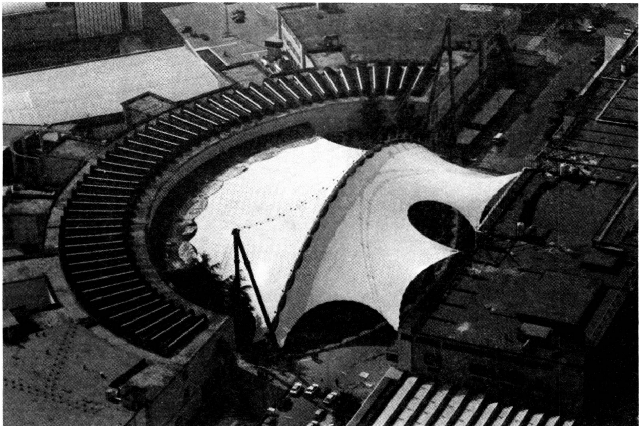
Fig. 2 Aerial view of the construction

The main system, oriented along the principal axis of the roof surface, is formed of a pre-stressed cable-truss which has a span of 125 m.