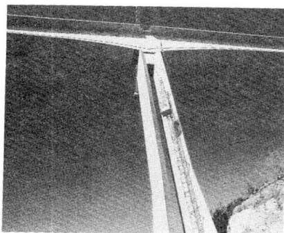
Vue de la pile P5

Ces piles à double fût ont été conçues pour permettre à la vue d'aller au-delà du point d'appui et de favoriser la "transparence" de l'ouvrage. En effet, depuis la rue Wilson, face à la Poste, l'on peut voir la pile P4. Nous avons cherché à proposer un effet de porte, de double lame. Le soleil couchant est visible à travers ce bi-lame depuis Cahors. La forme trapézoïdale des piles reprend la famille des formes des anciens ponts avec avant-bec. La base des deux piles de grande hauteur est fruitée sur le premier tiers pour accentuer l'effet de jaillissement du sol. Les plans avant et arrière du chevêtre prolongent celui de l'âme. Un traitement par cannelures a été réalisé sur les parements des piles et un cadran solaire a été implanté.