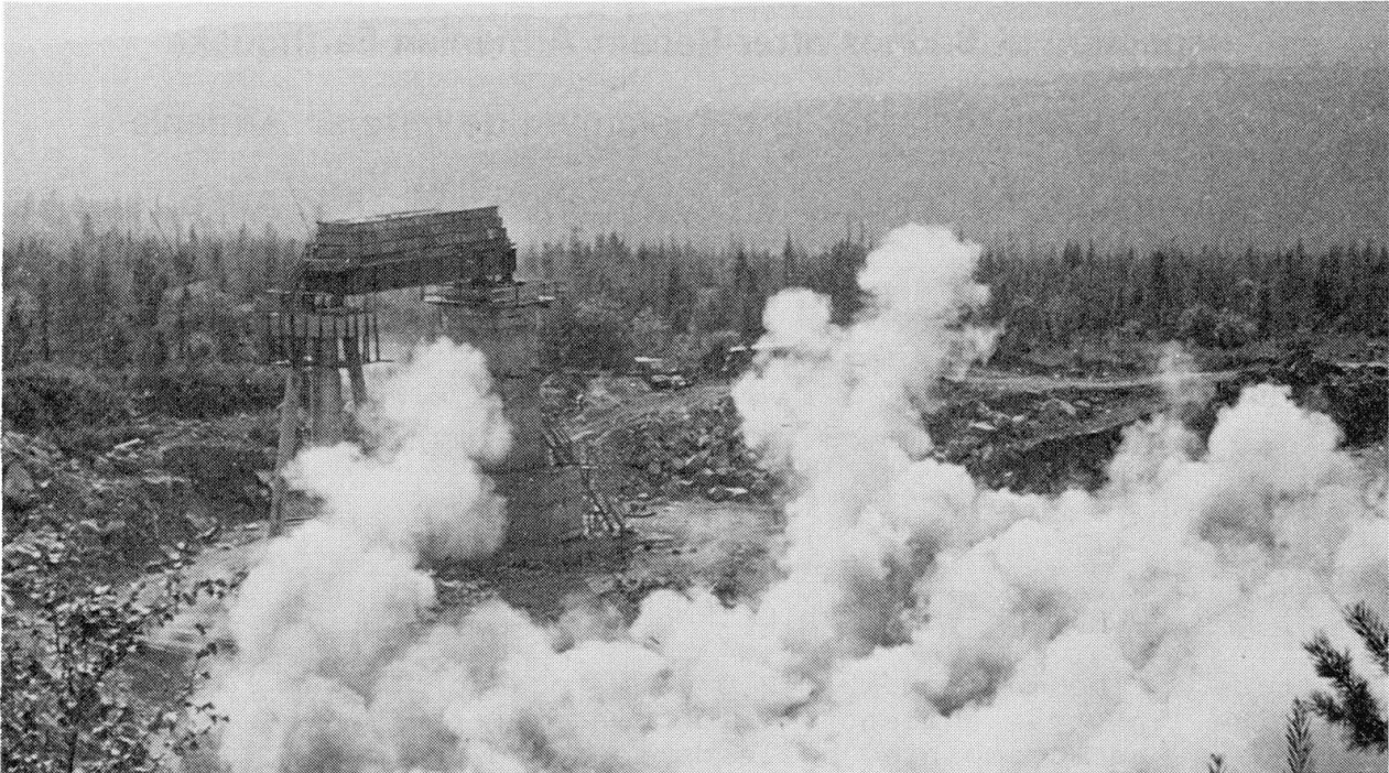
Fig.2. Explosion effect

Oscillations of the bridge section and adjoining ground sections were registered by the standard engineering-seismomentering equipment with galvanometric recording. Data on displacement, speed and acceleration of the pier foundations, posts and packings of the frame pier, lower and upper blocks of the massive pier and span structure were fixed. Evaluation of the ground oscillation intensity proved it to be close 9 numbers of the MSK scale (ground accelerations reached 0.4 g). As a result of tests, a large amount of full-scale data was obtained making it possible to assess the errors of the employed methods of pier calculations receive information on the actual seismic stability of the structures under tests. The test results have proved the possibility of simulating the seismic effects of 9 numbers in force by a high power explosion. Analysis of the instrumental data obtained made it possible to make a conclusion of a high seismic stability of the frame-type pier.