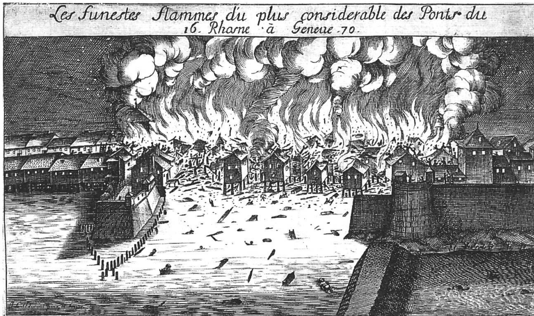
L'incendie du pont, vue tirée de Abraham Bonnet, «Poème sur l'embrasement arrivé à Genève sur le pont du Rhodne, dès la nuit du lundy 17 jusques au jour du mardy 18 janvier 1670», Genève, 1671?

là d'opérer une véritable stratégie de survie devant les forces de la nature, pour l'intégrer, l'assimiler et la maîtriser » 12 .