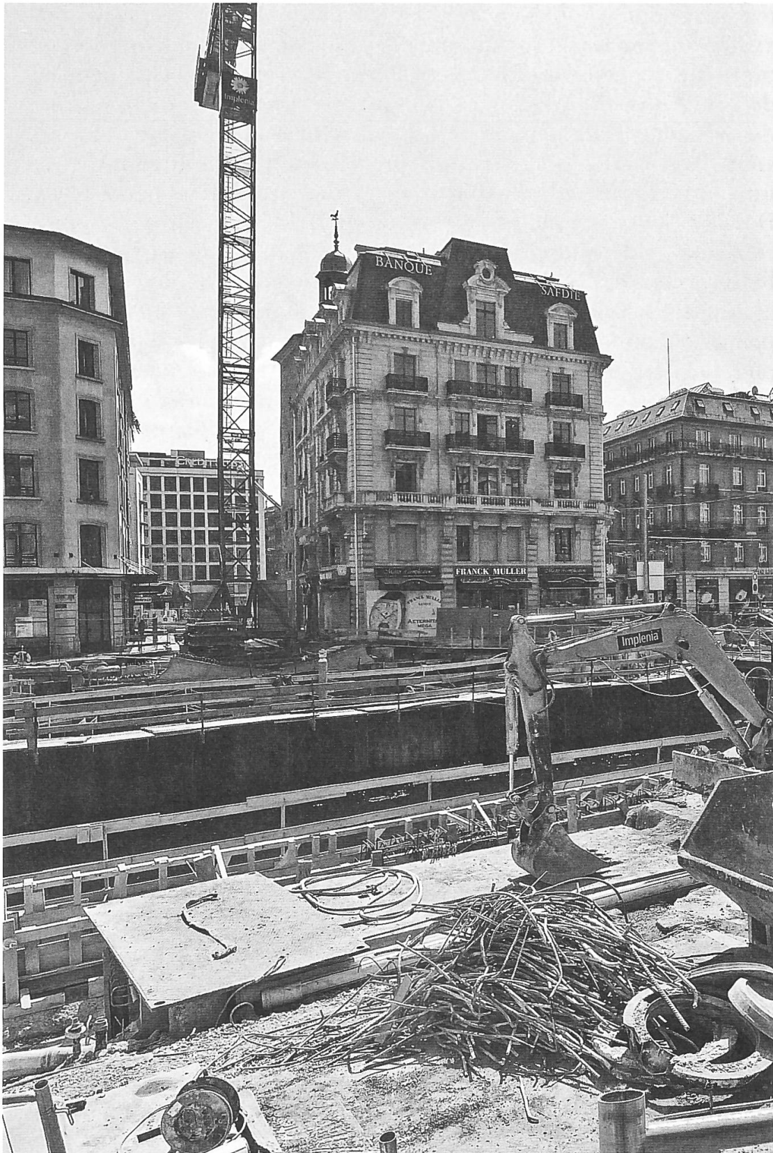
Le pont de l'Île au XXI e siècle – Construction des piles et du tablier, avril 2011