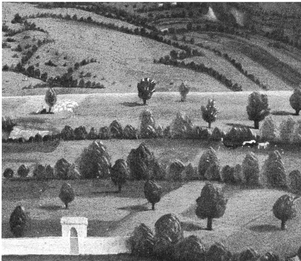
Fig. 18 ci contre et page précédente Trains de labour genevois en 1444. © Musée d'art et d'histoire, Ville de Genève, inv. no 1843-11, Konrad Witz, La Pêche miraculeuse , photographie Bettina Jacot-Descombes. NDLR: nous nous permettons d'insérer ces deux détails du célèbre tableau de Konrad Witz qui étaient restés inconnus de l'auteur.