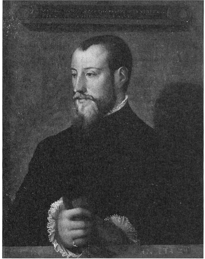
Fig. 2 Anonyme, Portrait de Théodore de Bèze jeune à l'âge de 24 ans , milieu du XVI e siècle, 45 × 32 cm, Bibliothèque de Genève (collection du Musée historique de la Réformation, inv. mhr t 32).

Le fils de Théodore Tronchin, Louis I Tronchin (1629-1705), pasteur et professeur de théologie à l'Académie de Genève, incarne, avec quelques-uns de ses contemporains tel que Jean-Robert Chouet (1642-1731), un renouveau du protestantisme de la République lémanique du fait du rapprochement du cartésianisme qu'ils ont opéré. C'est probablement à l'initiative de l'un de ses élèves, le théologien Jean-Alphonse Turretini (1671-1737), que Jean Dassier (1676-1763) réalisa en 1725 la série des médailles intitulées les Réformateurs de l'Eglise , illustrant des théologiens de plusieurs pays 20 . Louis I