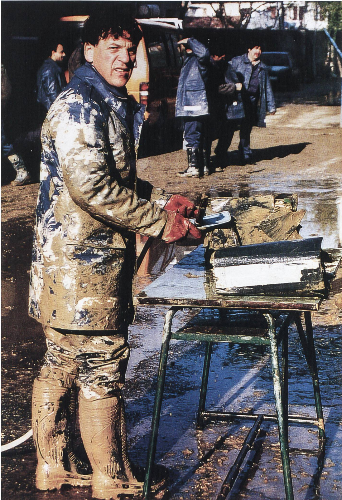
Intervento della Protezione Civile di Locarno in Italia, ad Alba - Canelli, novembre 1994. Un milite lava documenti estratti dall'archivio comunale alluvionato. Consorzio PCi Regione Locarno e Vallemaggia.