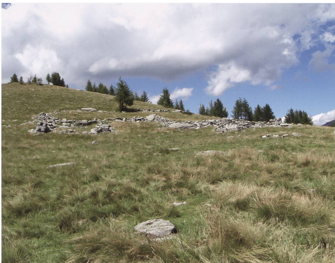
Rovine di cascine sull'alpe Salei