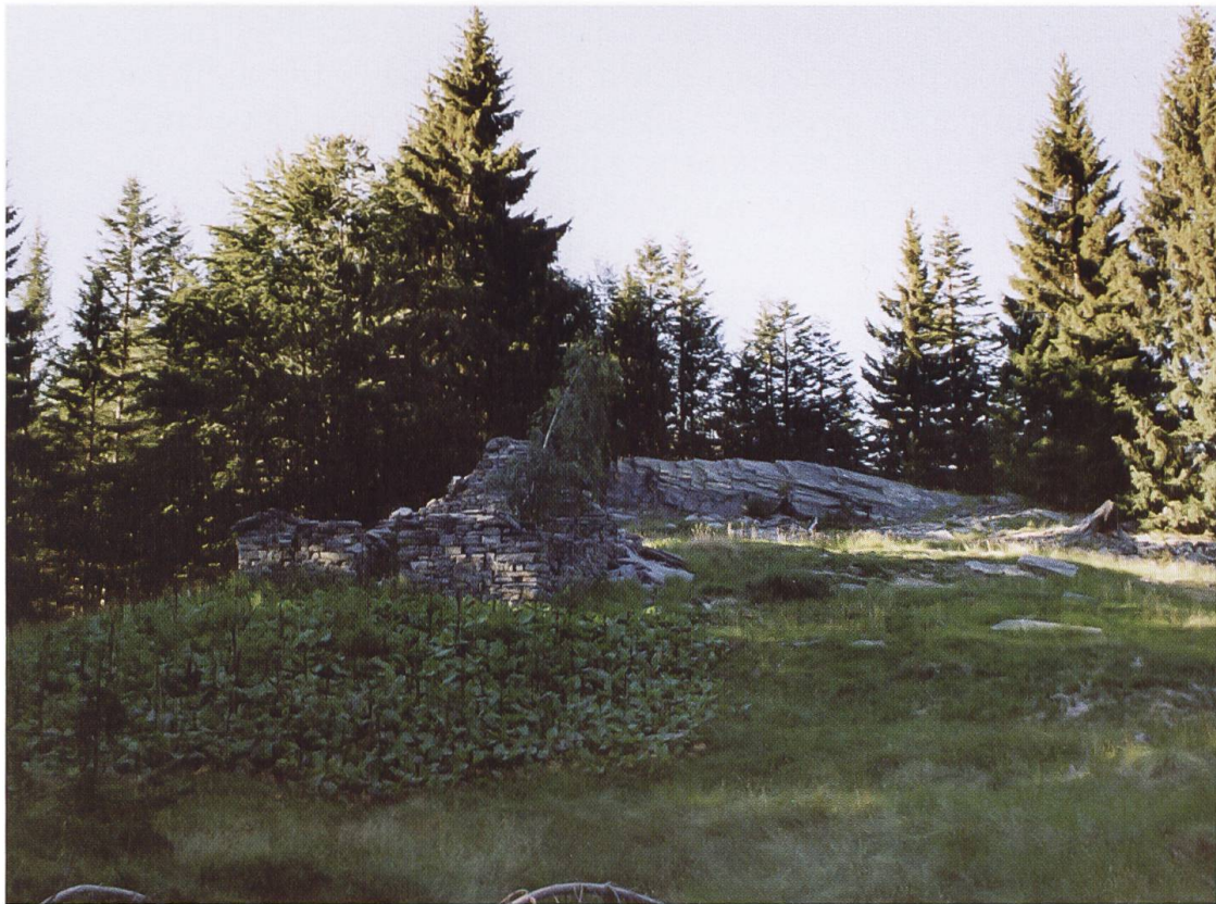
Corte del Sasso nel comprensorio dell'alpe Arbellia

sto) 34 . Gli Orelli continuarono a mantenere diritti e canoni sull'alpe Categn e nel 1441 Andriollo Orelli affittò ai vicini di Centovalli un canone di quattro lire di terzoli da consegnare ogni anno per la festa di San Martino (11 novembre). Il canone di quattro lire di terzoli non gravava solamente sull'alpe Categn, ma pure sugli alpi Albezzona e Porcaresc, ed era così ripartito: il canone sull'alpe Categn era di diciotto denari nuovi, al computo di dieci lire di terzoli ficti veteris ; sull'alpe Albezzona di diciannove soldi e nove denari, al computo di dieci lire di terzoli ficti veteris ; e sull'alpe Porcaresc di cinque soldi e tre denari di terzoli, al computo di cinque lire di terzoli ficti veteris 35 . Come visto, questo canone di quattro lire di terzoli, che i vicini di Centovalli erano soliti versare annualmente agli Orelli, fu venduto nel 1514