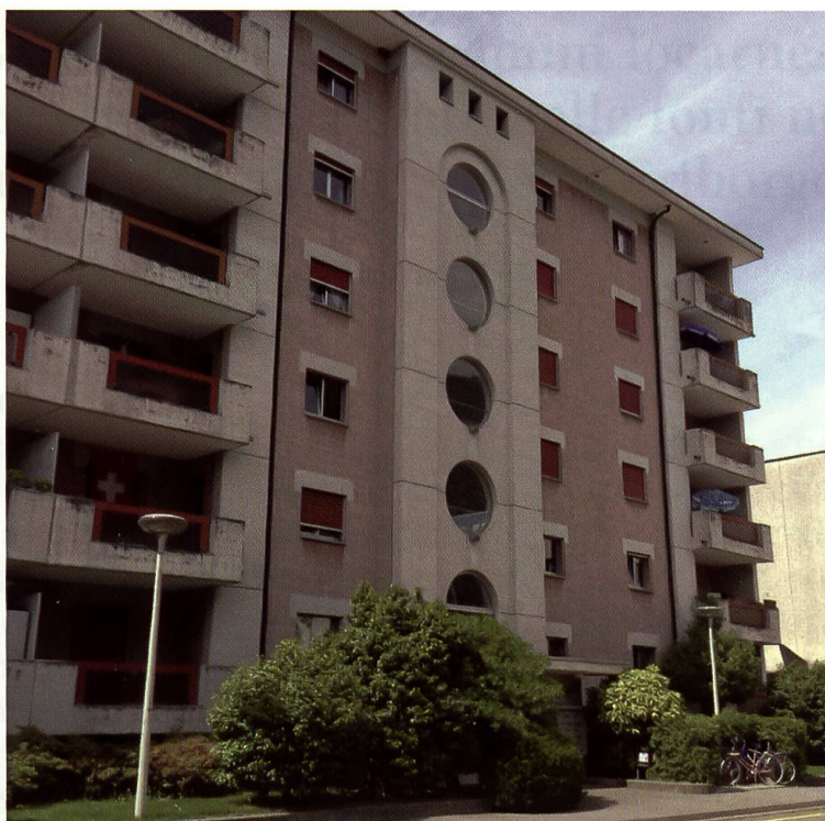
Casa Margherita a Locarno con 18 appartamenti a pigione moderata e sede della Società di Mutuo soccorso maschile di Locarno