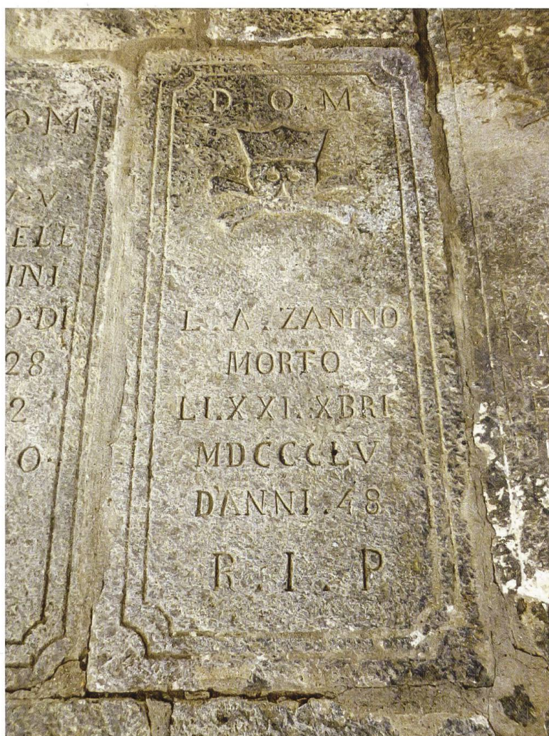
La pietra tombale nell'ossario di Caveragno

Sofferente da alcuni mesi muore, nemmeno cinquantenne, pochi giorni prima del Natale 1855 10 , dopo essersi confessato e aver ricevuto l'unzione degli infermi dai suoi confratelli di Sornico e di Bignasco. È sepolto a Caveragno, nell'ossario che affianca la chiesa, dove una lapide ancora lo ricorda.