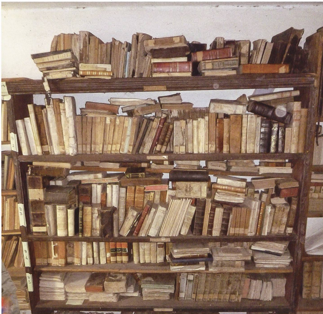
Dettaglio della biblioteca dei parroci di Caveragno come si presentava al momento del ritrovamento nell'ottobre 2013