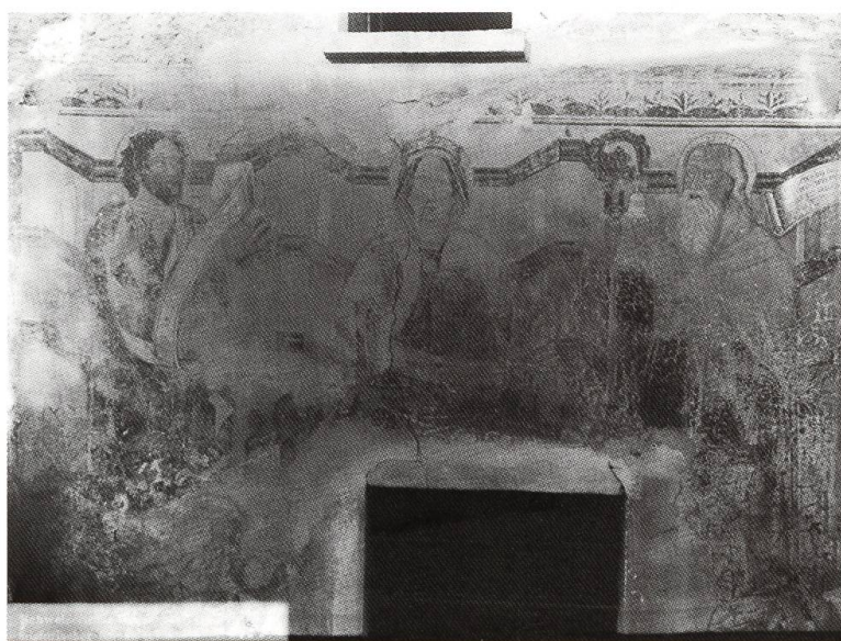
Minusio, Casa Filipelli, 1903.

zie alla descrizione di Rahn che lo attribuiva a un pittore tardogotico, era noto a Gilardoni e Mondada, e quest'ultimo riporta che nel 1917 parte dell'edificio fu distrutto per essere trasformato nel ristorante Torcett, punto di ritrovo per molti abitanti di Minusio nonché apprezzato luogo di ristoro per i villeggianti 3 . Questo intervento ricoprì e danneggiò ulteriormente l'affresco, facendo sparire completamente la Madonna e i santi. Probabilmente i proprietari di allora non compresero il valore di questo affresco. La fotografia di Egidio De Luca, conservata alla Biblioteca nazionale svizzera a Berna, permette quindi di prendere visione dell'intera composizione.