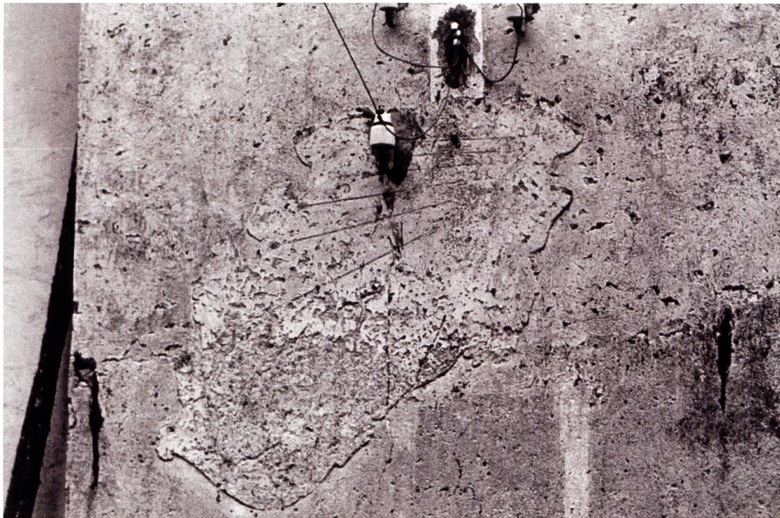
Castello Marcacci, Brione Verzasca, quadrante solare nel 1972.

antichi ad ore italiche. La possibilità di identificare ancora queste deboli tracce come orologi solari, si deve appunto alla ricerca eseguita durante la realizzazione di questo libro: sono infatti pubblicate fotografie di questi quadranti risalenti al 1972. Non resta che auspicare un sollecito e fedele restauro.