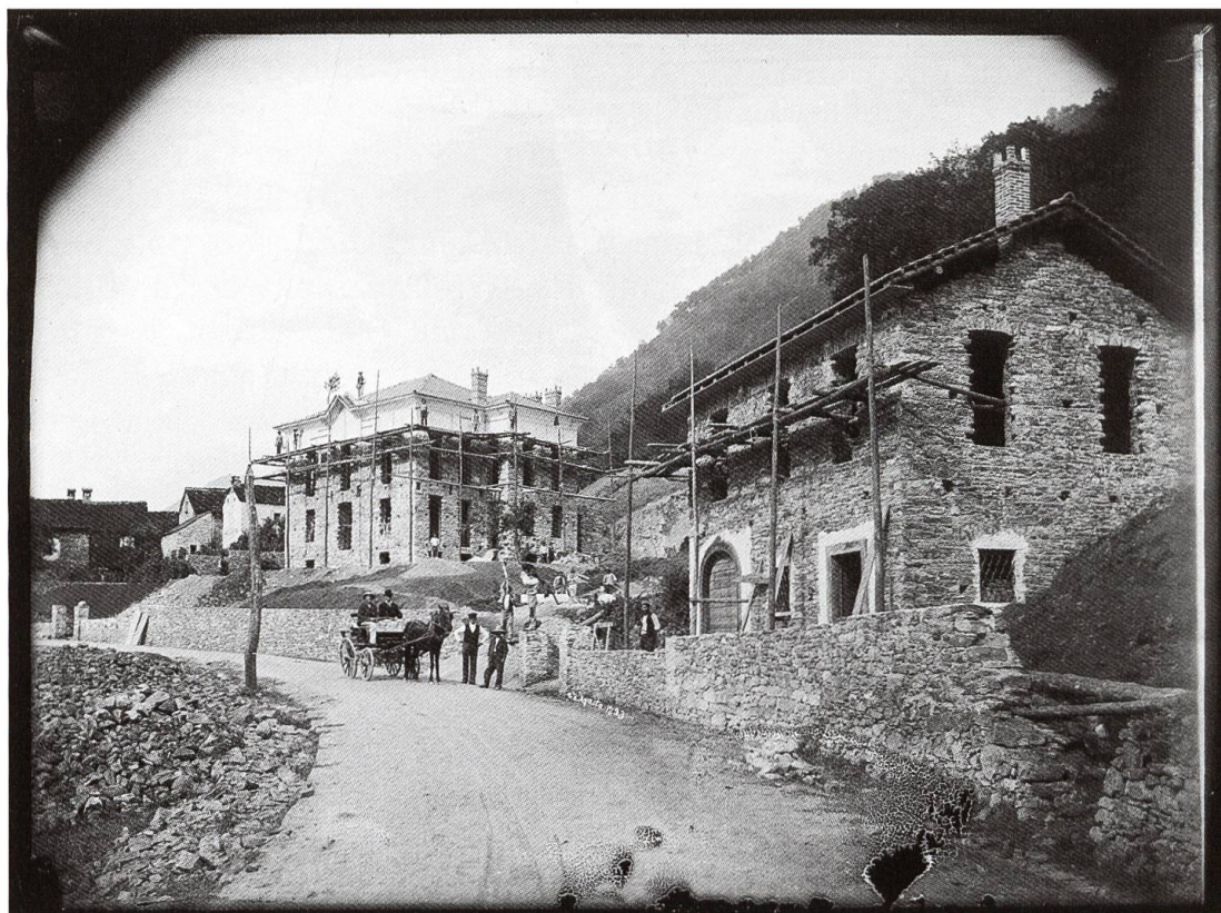
Stato dei lavori di costruzione di villa Peri il 28 agosto 1893.