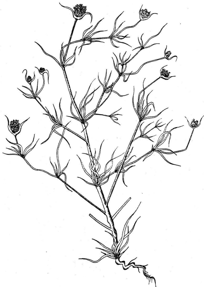
Fig. 1. Plantago cynops L. (Hauteur : 40 cm.)

2160. Phyteuma spicatum L. ssp. coeruleum (Gremli) R. Schulz, La Joux-Perret, 1050 m., près de la Chaux-de-Fonds (R. Steiner et G. Tuetey). Sauf erreur, cette intéressante trouvaille n'a pas encore été signalée dans la littérature floristique. 1927.