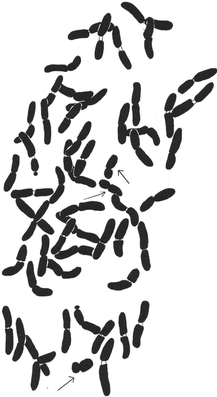
Fig. 1. Chrysanthemum Leucanthemum . Plante hexaploïde du Crêt de la Neige. 58/1237. 2n = 54 + 3B , ces derniers indiqués par une flèche.

submédiane et leur taille égale à peu près la moitié de celle d'un chromosome A.