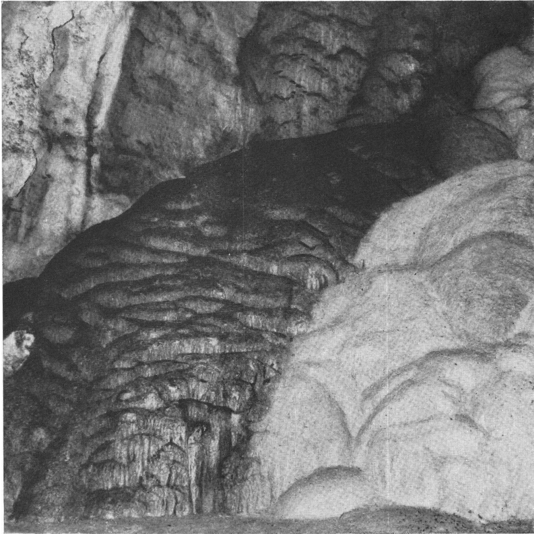
III. La grotte du Chemin-de-Fer, plancher stalagmitique plus ou moins couvert de guano.