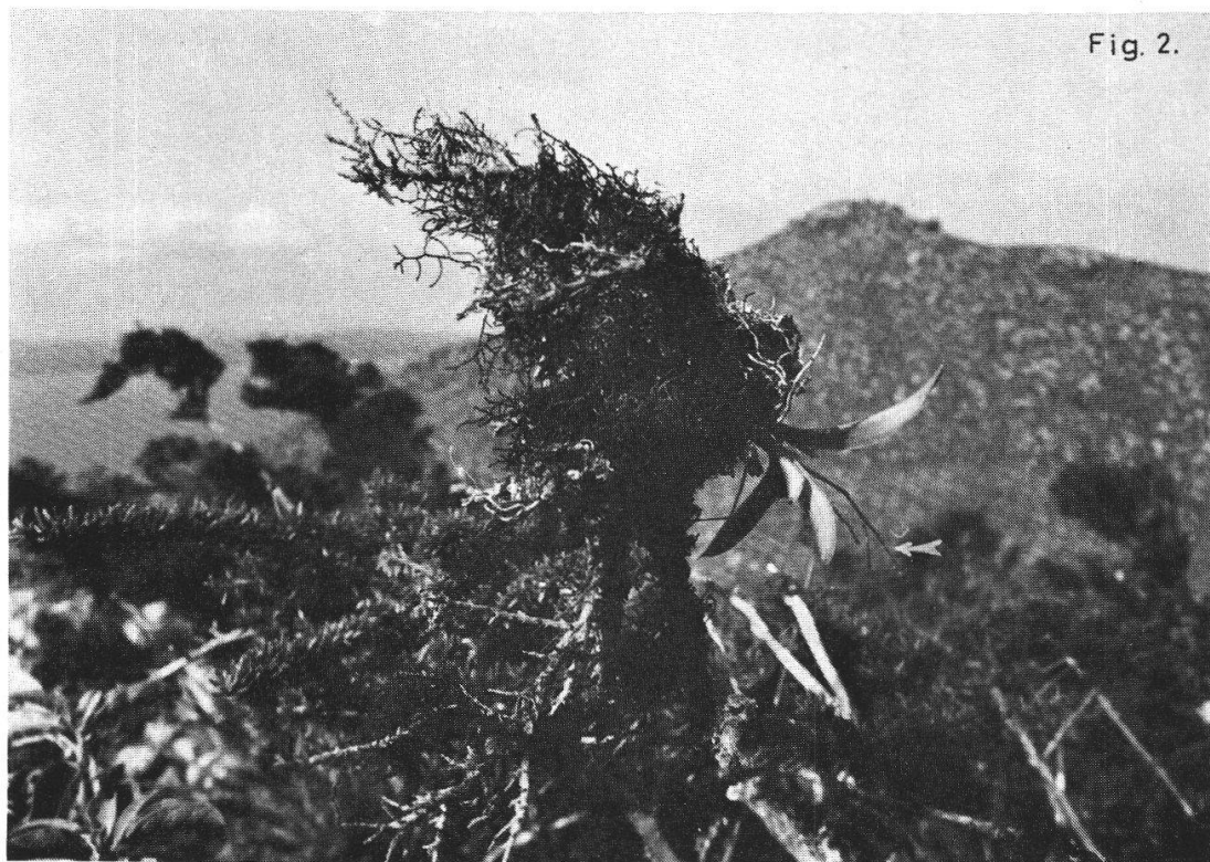
Fig. 2. Ile Rábida. Ionopsis aff. utricularioides épiphyte sur Macraea laricifolia . Altitude 350 m. Le 23 avril 1971.