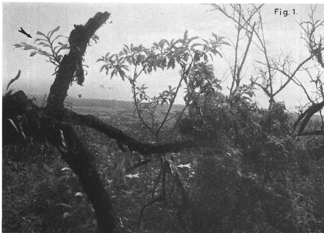
Fig. 1. Ile Fernandina. Epidendrum spicatum épiphyte sur Tournefortia sp. Au fond, marqué d'une croix, le Cabo Hammond. Altitude 530 m. Le 4 février 1970.