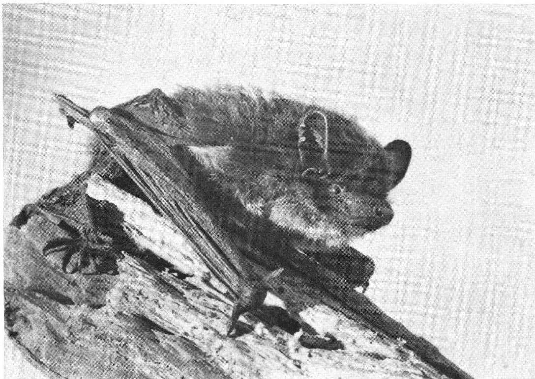
En haut : Murin de Natterer ( Myotis nattereri ). Grotte de Cotencher, Rochefort, 30 septembre 1969.