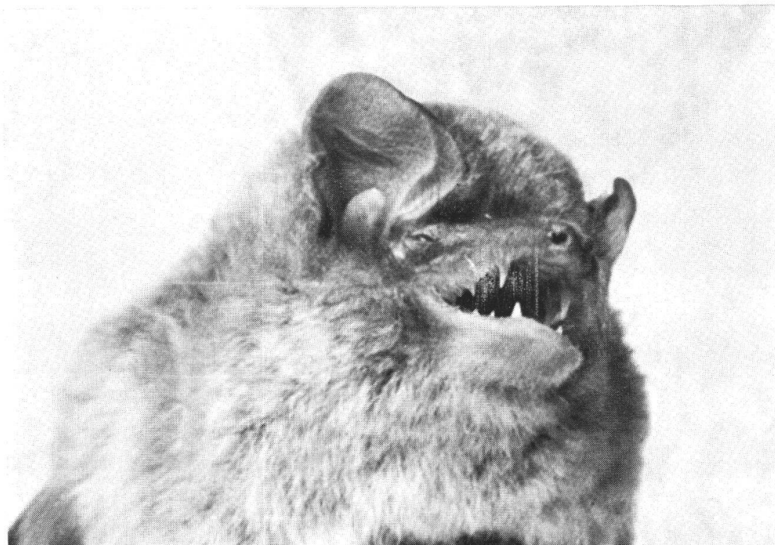
En haut : Pipistrelle commune ( Pipistrellus pipistrellus ). Grotte de Vert, Boudry, 17 décembre 1952.