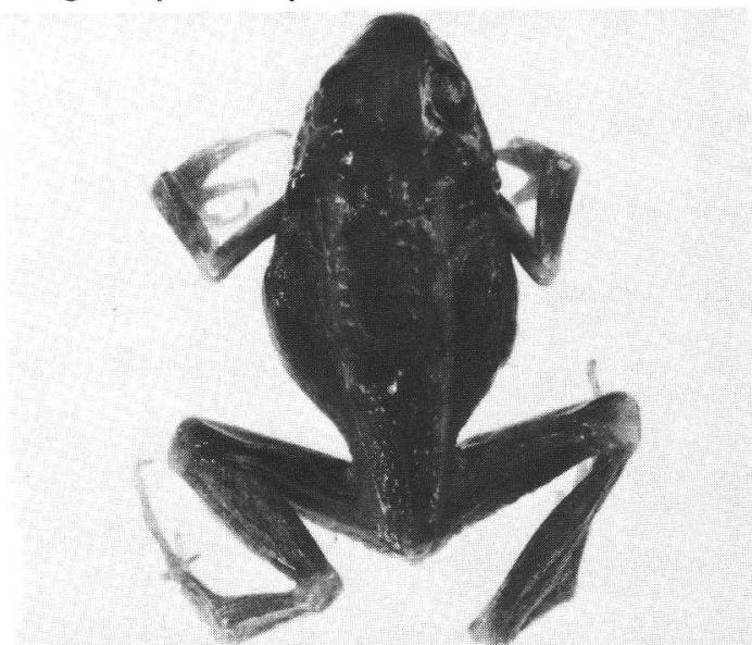
Fig. 1. Arthroleptis bivittatus F. Müller, holotype, Musée de Bâle, NHMB 1257 ♀, île Tumbo, Guinée. Unique exemplaire connu, sa livrée malheureusement ici décolorée, suggère tout de même une convergence vers A. poecilonotus (cf. fig. 3) mais son habitus trapu, l'écarte d'emblée d' A. taeniatus avec lequel il a été à tort confondu (cf. fig. 2). 2/1.

congénérique. Un caractère distinctif propre à bivittatus réside en la présence de deux raies claires dorsolatérales ( derivatio nominis ) qui sont en réalité moins rectilignes et contrastées qu'elles n'apparaissent dans la figure (pl. IX, fig. k) publiée par MÜLLER (1885).