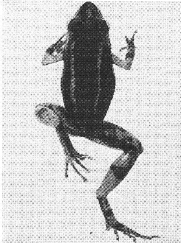
Fig. 2. Arthroleptis taeniatus Boulenger, topotype ♀, Muséum de Genève, de Sangmelima, Cameroun (abréviation: Zima, fide Boulenger). Tout à fait distinct de bivittatus et poecilonotus par son habitus svelte, longiligne, la tête plus longue que large, les disques digitaux dilatés. Objet de confusion, discuté dans cet article. 2/1.

dans un ouvrage qui doit recenser seulement des données publiées, discutables ou non. Elle est en plus malheureusement erronée.