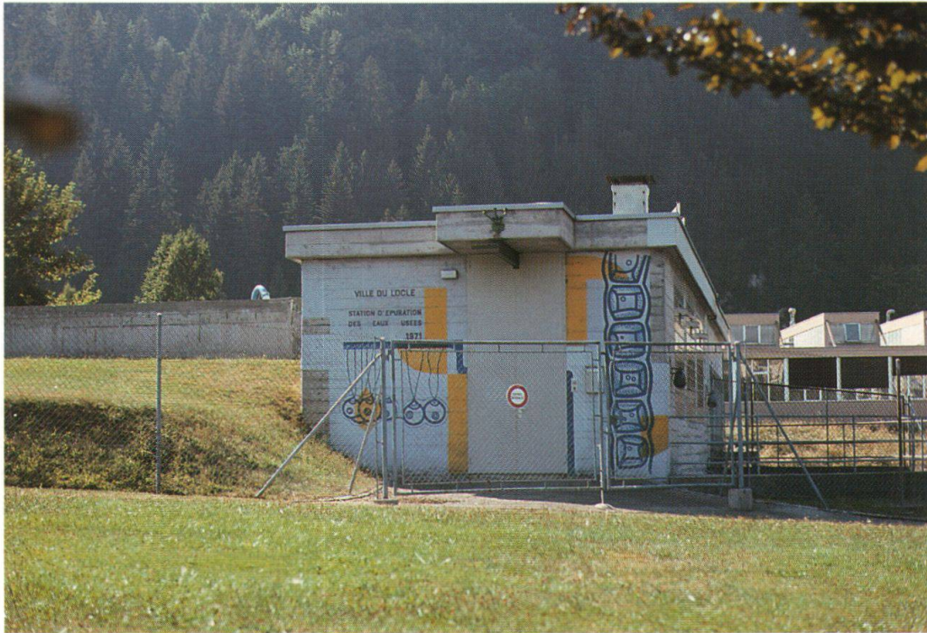
Fig. 1: STEP Le Locle. Bâtiment d'entrée. A droite de la façade, les cellules d'un filament stylisé d' Ulothrix rappellent les briques de verre utilisées comme fenêtres, tandis qu'à gauche, une colonie de Tetraspora gelatinosa fait office de cul-de-lampe au texte de l'enseigne.