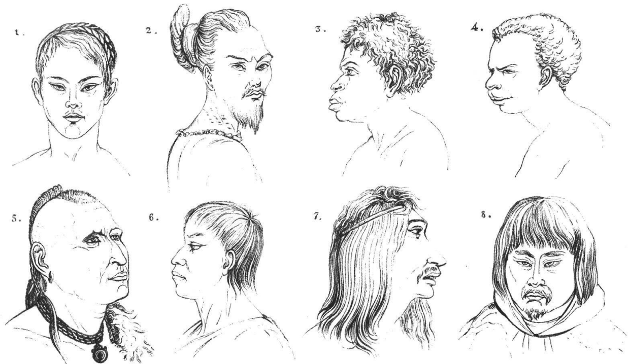
Figure 1 : Les différentes races selon GUYOT 1855, pl. V et VI, p. 258 et 259. La race blanche impose sa classe par le regard inspiré d'un gentilhomme. Visages plus ou moins plaisants dans les autres ethnies.