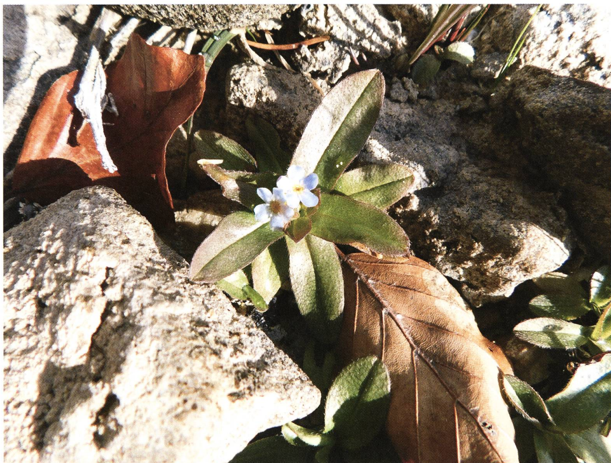
Figure 1. Myosotis rehsteineri Wartm., grève exondée du lac de Joux, Le Rocheray, 3.11.2018

Depuis 2003, nous observons très épisodiquement sur la grève exondée du lac de Joux, disséminé à diverses places, un Myosotis scorpioides aggr. de taille petite à moyenne [5-13 cm], à inflorescence souvent unicaule, et tige ± cylindrique. Mais d'autres exemplaires quasi semblables atteignent également souvent 20-25 cm; leur tige est alors légèrement anguleuse, du fait de la décurrence des