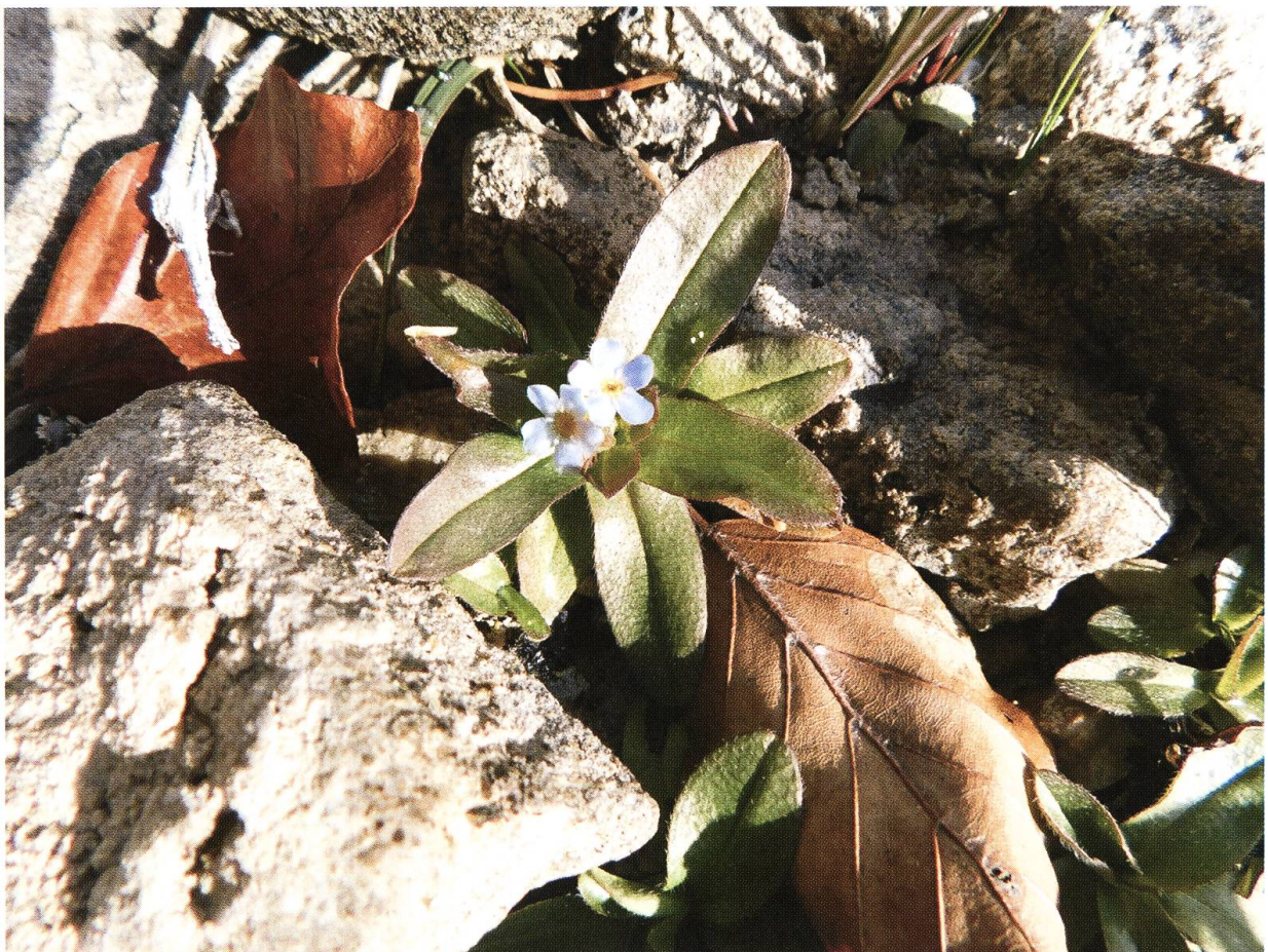
Figure 1. Myosotis rehsteineri Wartm., grève exondée du lac de Joux, Le Rocheray, 3.11.2018

Depuis 2003, nous observons très épisodiquement sur la grève exondée du lac de Joux, disséminé à diverses places, un Myosotis scorpioides aggr. de taille petite à moyenne [5-13 cm], à inflorescence souvent unicaule, et tige ± cylindrique. Mais d'autres exemplaires quasi semblables atteignent également souvent 20-25 cm; leur tige est alors légèrement anguleuse, du fait de la décurrence des