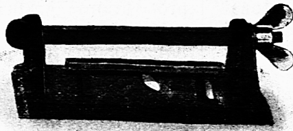
Kontraktionsapparat nach Tyndall.