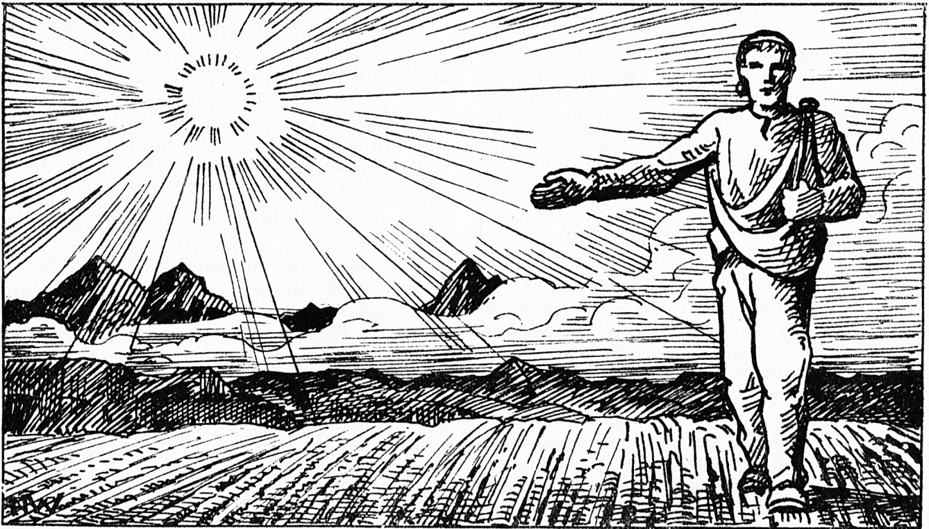
Zeichnung von Hr. Würgeler, Bern