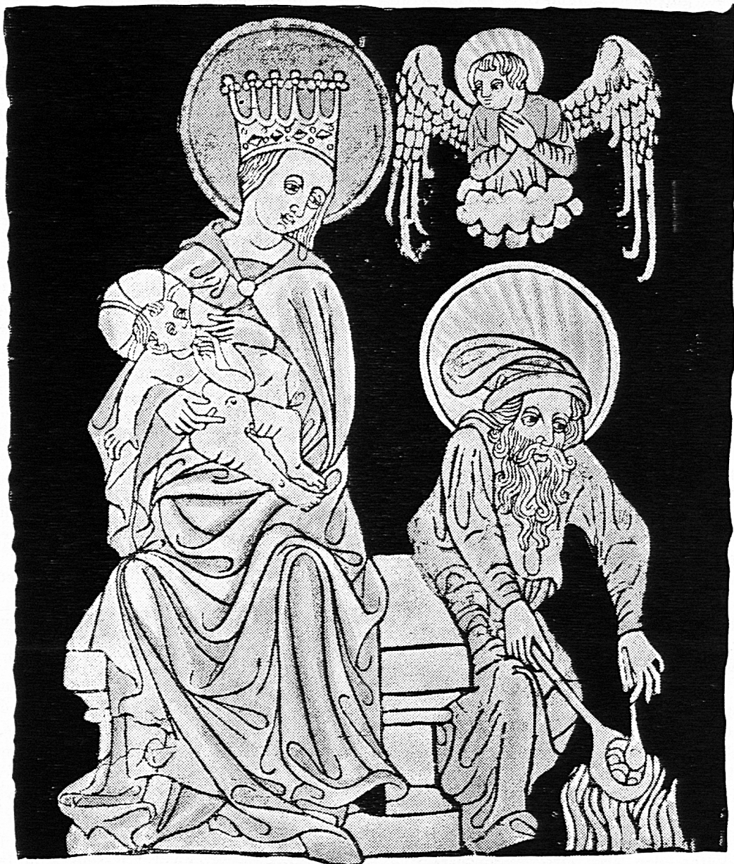
Die Heilige Familie, Holzschnitt aus dem Jahre 1440