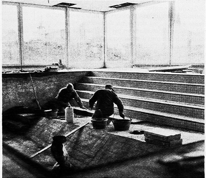
Ausbau im Schwimmbecken Plättlleger an der Arbeit

Wir freuen uns und hoffen zugleich, dass auch die Frage der Finanzierung in Bälde positiv gelöst werden kann. Deshalb danken wir allen, die uns uneigennützig und tatkräftig geholfen haben – oder uns noch helfen werden. Denn die Aktion wird auch im neuen Jahr weitergeführt! PC 30 - 4450.