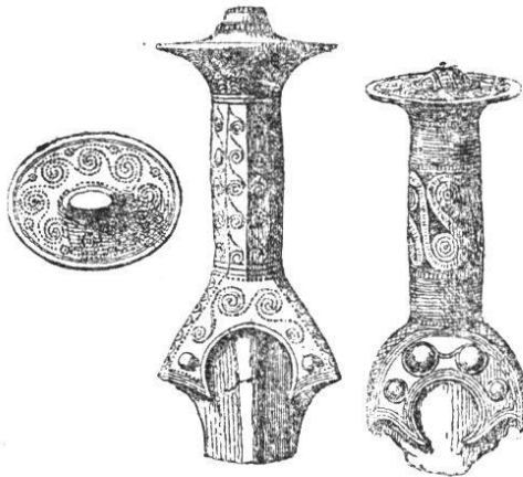
Fig. 2. (1/4)