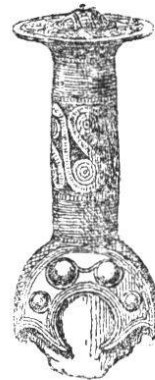
Fig. 3. (1/4)

sons de formes géométriques, d'un goût pur et d'une beauté réelle dans son genre, quoiqu'il manque toute représentation d'objet vivant, soit plante, soit animal. Ce n'est qu'avec l'introduction du fer, que l'art, prenant un essor bien autrement grand, s'est élevé à la représentation de la plante, de l'animal et de l'homme. Aussi ne connaît-on point d'idoles de l'âge du bronze ni de l'âge de la pierre en Europe. Il est à présumer, que le culte du feu, du soleil et de la lune a régné dans la haute antiquité, du moins pendant l'âge du bronze, peut-être aussi dès l'âge de la pierre.