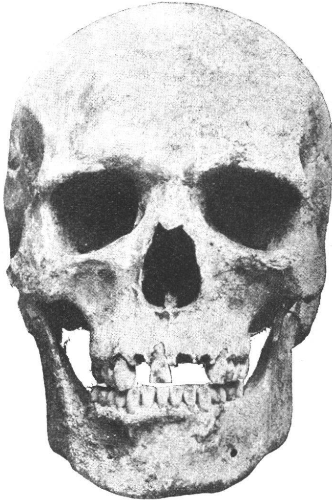
Fig. 20. — Crâne masculin n° 4. Norma facialis .

Norma facialis (fig. 20). — La vue de face montre un front bien développé, ne s'élargissant que faiblement en montant, les crêtes temporales du frontal étant, en général, peu divergentes; les deux diamètres frontal minimum et stéphanique ne présentent pas une très grande différence de longueur. Les arcades sourcilières sont peu développées, mais constituent cependant une glabelle légèrement proéminente, la saillie correspond au n° 1 de la nomenclature de Broca; elles sont plus développées du côté interne (médian) que du côté externe; les bosses frontales sont bien