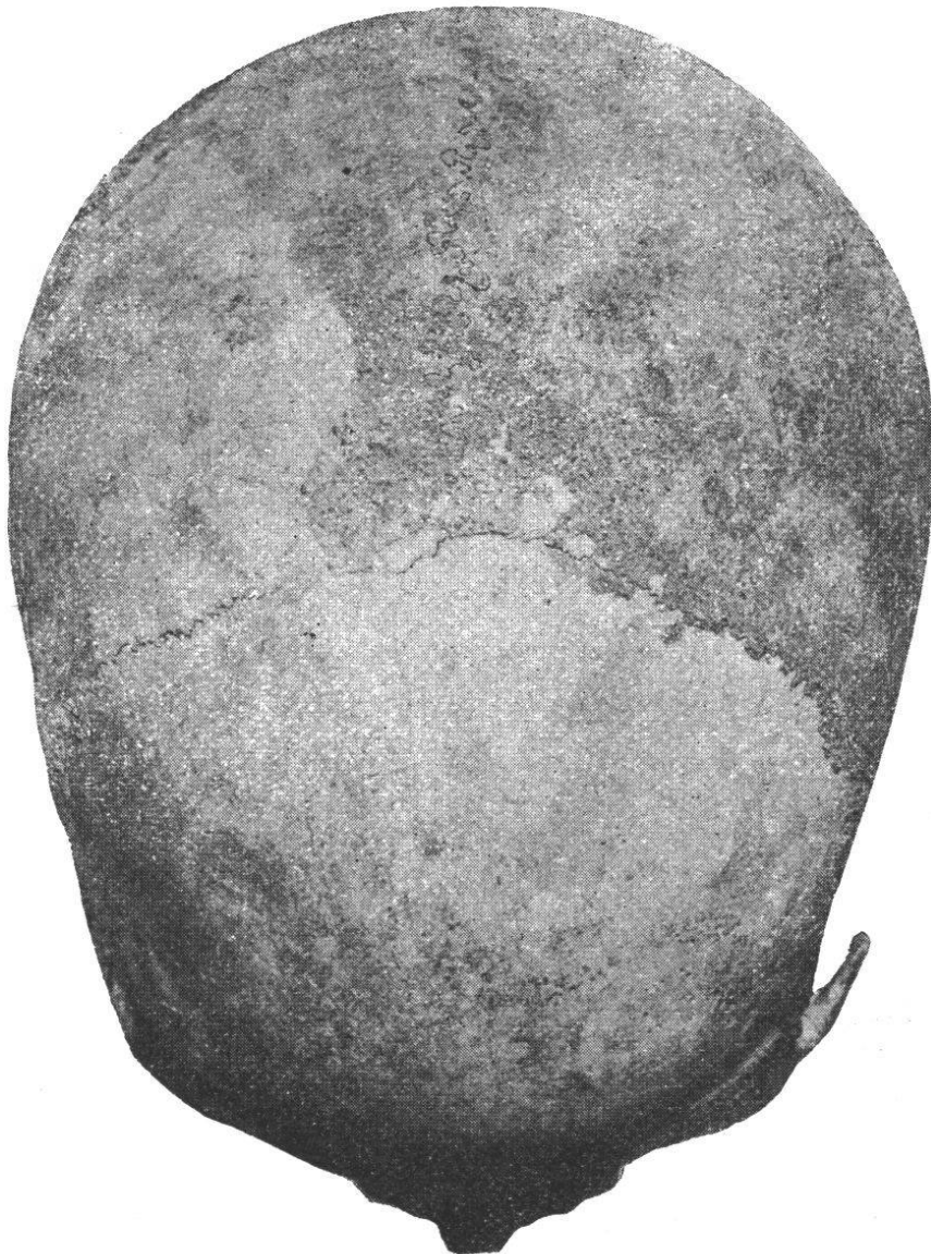
Fig. 22. — Crâne masculin n° 4. Norma verticalis .

Les apophyses mastoïdes sont bien développées; il en est de même des arcades zygomatiques et des fosses temporales; les lignes musculaires temporales ne sont pas très élevées et le ptérion est normal.