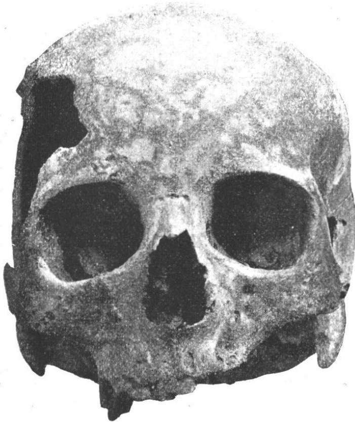
Fig. 32. — Crâne féminin n° 19. Norma facialis .

chants; les trous sus-orbitaires font défaut; il existe une légère échancrure sus-orbitaire du côté droit. La racine